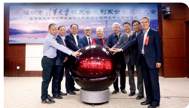
嘉宾启动水利系分会成立仪式球

大会还举行了“清华大学深圳研究生院水科学与工程研究中心”揭牌仪式。该中心将通过资源整合、机制创新和开放合作研究，打造