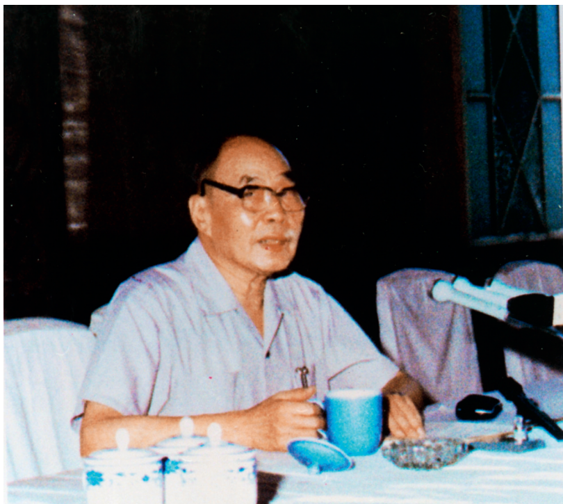
1985年蒋南翔在中国高等教育学会第一届理事会上讲话

蒋校长几次调整学制的举措给我们的启示是，一方面，学制是限定学生培养过程的制度框架，