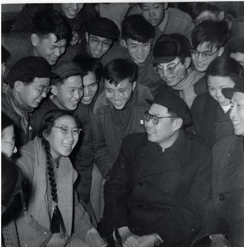
1962年，蒋南翔和清华1962年电机系的毕业生在一起

也有很强的组织管理人员，一些好的想法落实不下去，恐怕还是缺少反映师生心声并能一呼百应的行动口号。