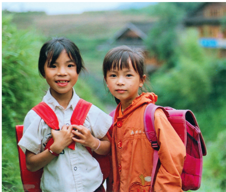
云南省南涧县的两个小姑娘

同时也定期举办专题培训把当地的学员“请进来”——选拔部分优秀学员来清华参加面授学习，面授的课程内容则同步直播到各地远程教学站。清华远程教学站以点带面，将清华的优质资源“辐射”到贫困地区，累计受益各类人群 250 余万人。这种模式不仅充分发挥了清华在科技和教育资源上的优势，还最大限度上节省了人力物力、有效克服了地理、空间上的限制，成为清华教育扶贫的一大特色。