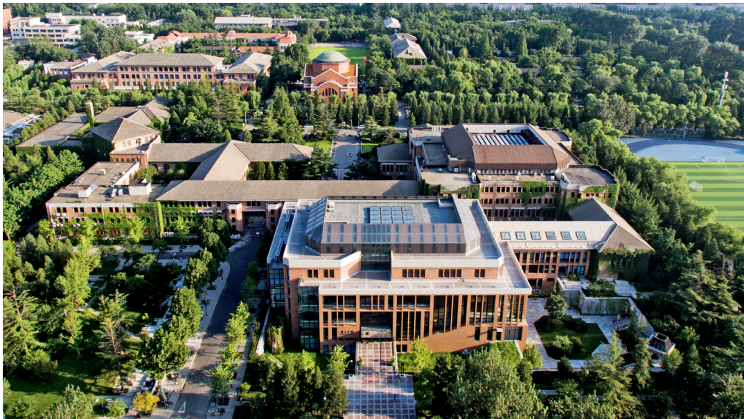
图书馆群实景鸟瞰