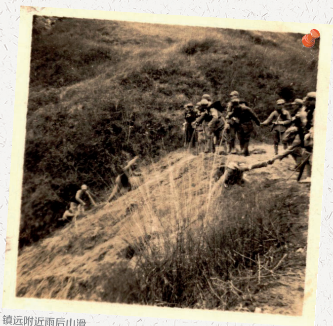
镇远附近雨后山滑

沿公路向西行，自小路爬上高山，路很倾斜，石块乱砌着，滑得很。爬上去一身大汗了。到达公路，已是山颠了，公路在高原上走，经过刘家庄，距贵阳 244 公里，不久就到了镇雄关（距贵阳 250 公里）。过了关便到一个极大的山谷了，公路蔓延而下，我从小路下来，路上是黄泥，危险得很，走到山谷深处，又沿小路上山了。路泥泞的不堪，我手攀着草根，足踏着泥凹，滑了不知多少次，都没有滑下去。上到公路线，公路又盘着镇雄关对岸的山而上了。又由小路上去，在远处走了一段，见到一个城门样的建筑。原来，因为前面是山，汽车上不去，所以才造的。汽车入城门转过圈子上石门的顶上，再由此上山，门顶写着“鹅翅膀”三个字，想是象形，闻一多先生在此画写生铅画一幅。