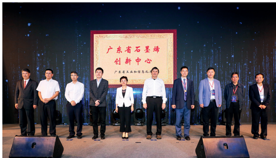
广东省石墨烯创新中心揭牌仪式现场