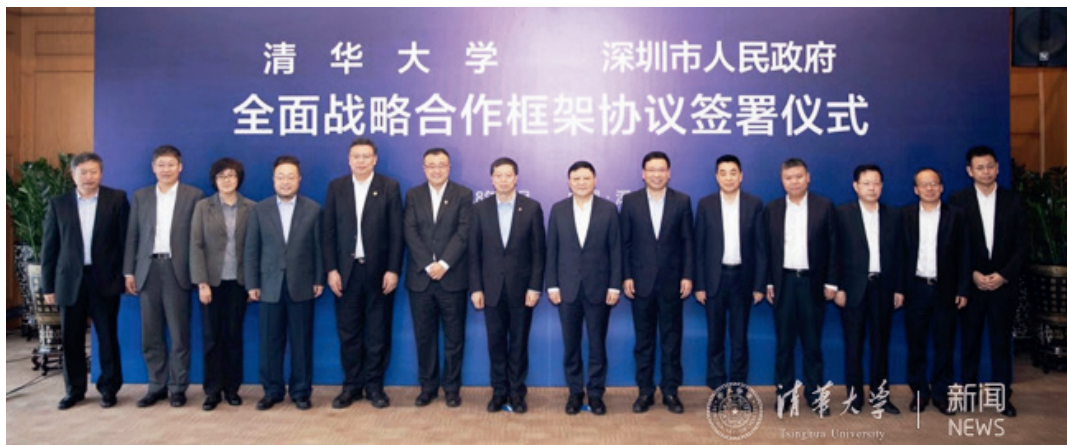
清华大学与深圳市人民政府签署全面战略合作框架协议