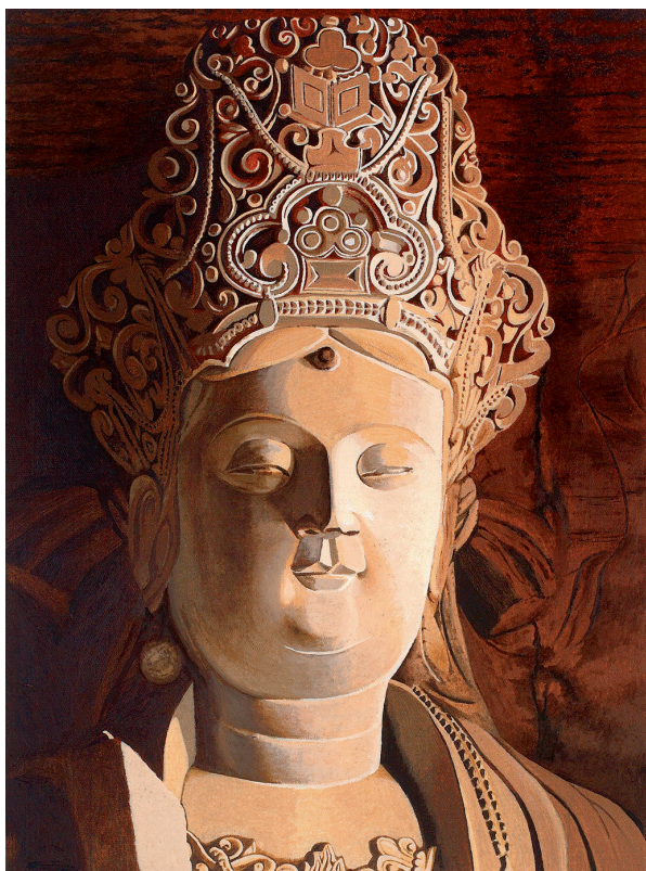
大足石刻·玉印观音头像