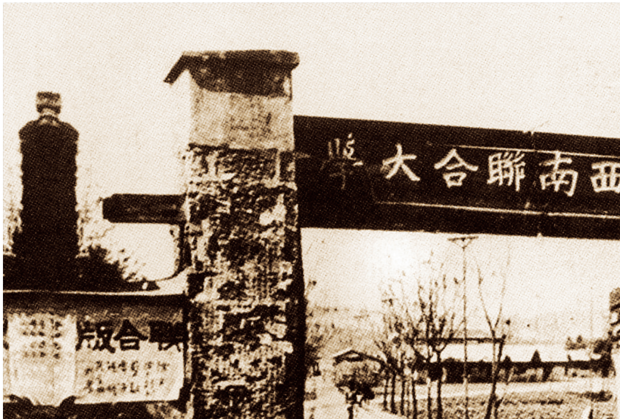
书中明仑大学的原型西南联大

归来已是青年。北归之后，作品的色彩逐渐变得鲜亮，校园里除了上课，开始有了朗诵音乐会溜冰舞会等集体活动，空气中飘荡着年轻人的欢声笑语，作者要有何等刻骨铭心的记忆，才能够把青春时光的苦闷愁绪、语气场景，栩栩如生地一一还原？