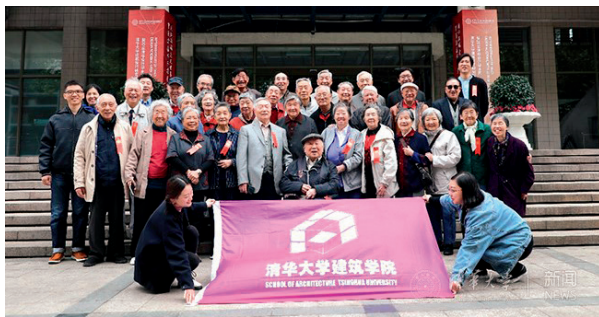
建筑学院 1959 届校友欢聚

已97岁高龄的吴良镛先生看到当年指导、现在已经白发苍苍的学生们感到格外的亲切，并握手致意。老校友们对母校、对吴良镛先生