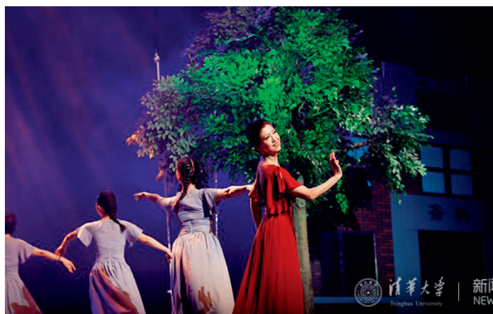
校友们献上精彩的文艺表演