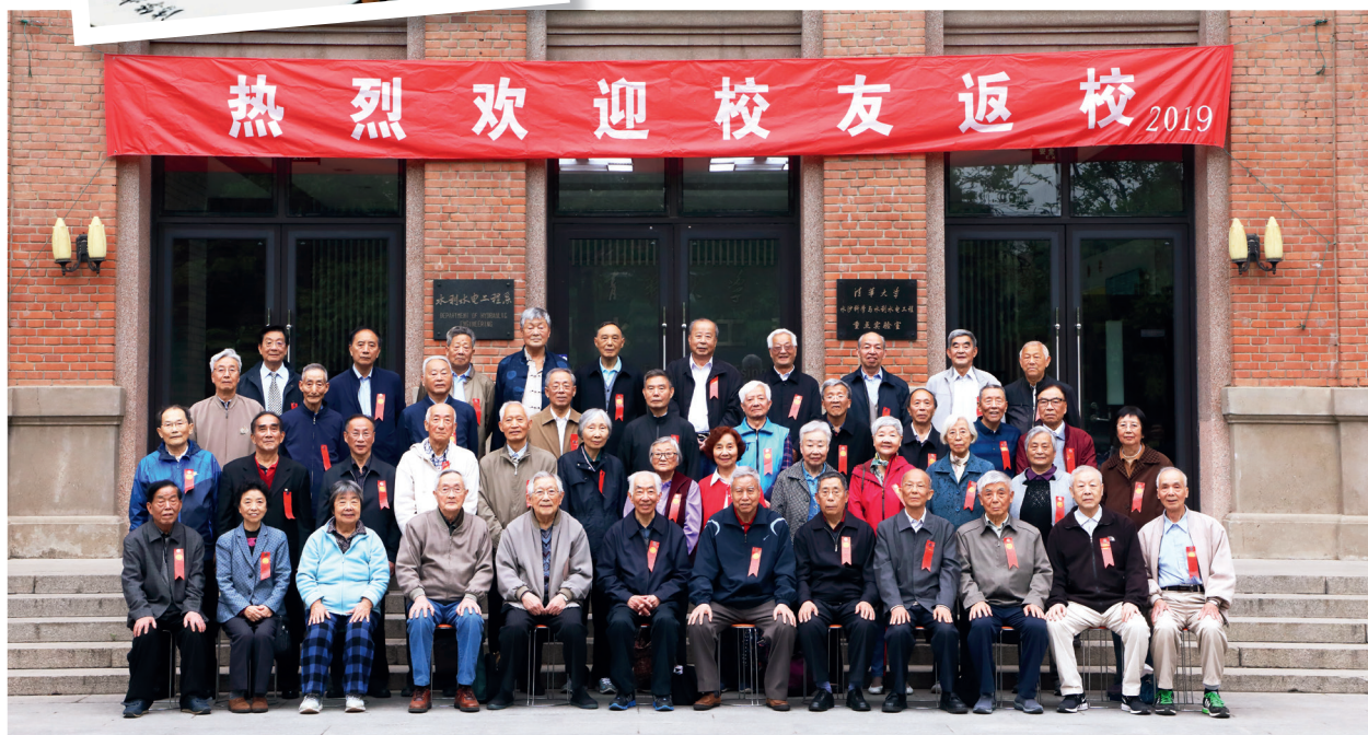
老校友们集体合影留念

校友们深情回顾了当年在校时的学习、生活，以及毕业后投身祖国建设的奋斗经历。张超然院士还为同学们作了题为《中国的大坝建设与技术创新》的报告。大家为今年80岁的校友集体庆祝生日，期待将来再次欢聚在母校。