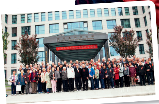
机械工程系 1969 届校友返校合影