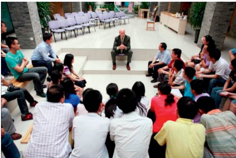
生命科学班同学与诺贝尔奖获得者 Phillip Sharp 教授座谈