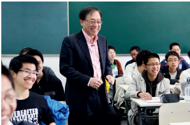
姚期智教授在课堂上

在本科低年级,智班学生将通过数学、计算机与人工智能的核心课程,打下扎实宽广的基础;在本科高年级,通过交叉联合 AI+X 课程项目的方式,有机会将人工智能与其他学科前沿相结合,推动人工智能前沿的发展。同时,智班的学生将获得与相关产业的联合实习机会,深入了解实际产业中的前沿基础科学问题,并通过人工智能知识与技术,加强人工智能在不同产业中的推广与应用。