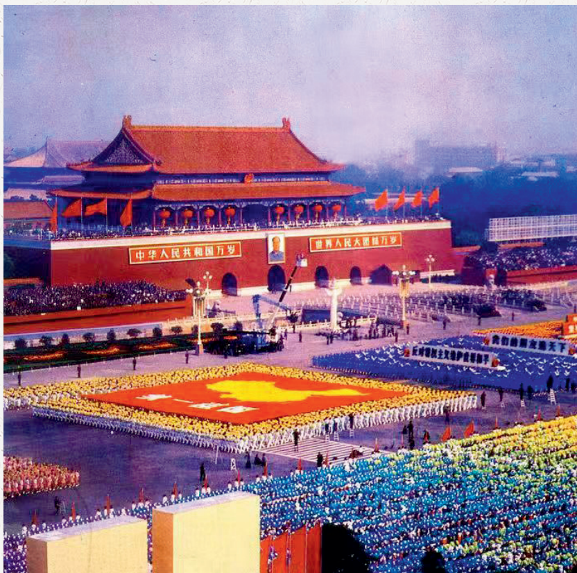
清华大学档案馆馆藏的1984年国庆游行照片 ——上千名大学生身着白色衣裤、高擎巨型中国地图走过天安门广场

当时，我是自动化系自22班学生，正上大三，还担任着系团委副书记等学生干部工作。在那年的首都国庆庆典中，清华承担了三项任务：一是选派1847名学生组成仪仗方队，走在整个游行队伍的前列，展示出一幅长30米、宽27米