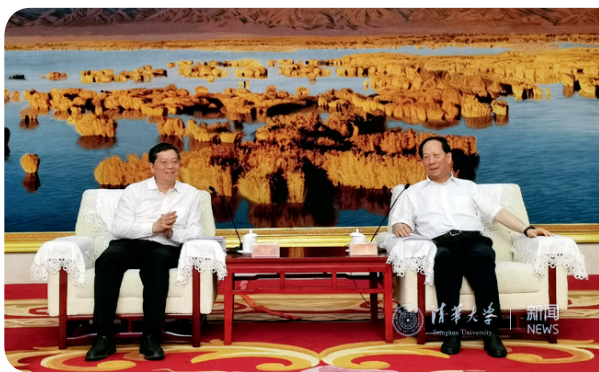
邱勇（左）与石泰峰会见交流

7月21日，宁夏回族自治区人民政府与清华大学战略合作协议签署仪式在宁夏银川举行。清华大学校长邱勇会见了宁夏回族自治区党委书记、人大常委会主任石泰峰，并与石泰峰一起见证签约。清华大学副校长杨斌、尤政出席会见与签约仪式。