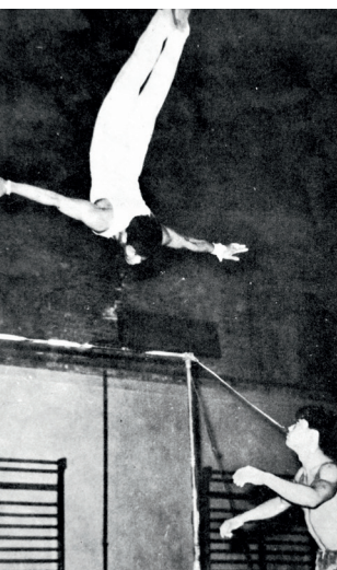
教练在悉心辅导运动员训练