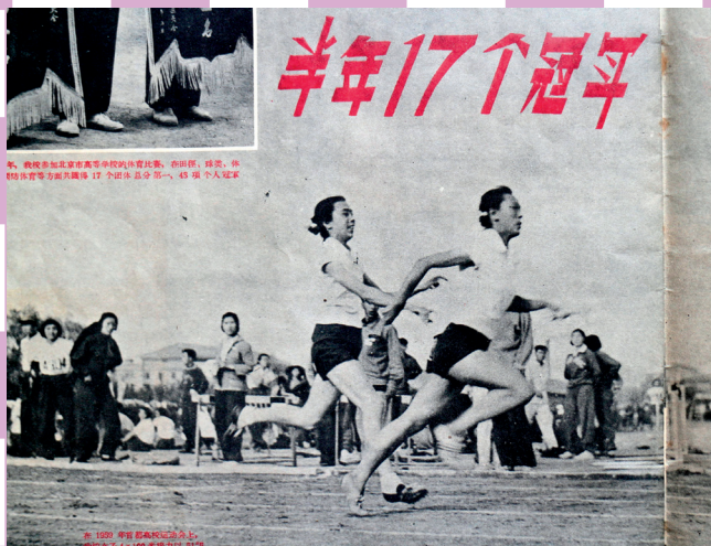
1959年北京高校运动会上，清华女子4×100接力队取得第一名