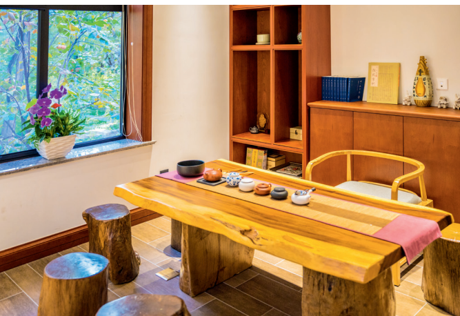
Tea House (茶室), 可容纳 10~15 人