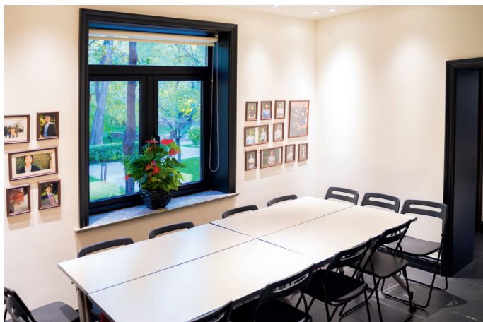
Meet & Greet Room (门厅), 可容纳 15~25 人