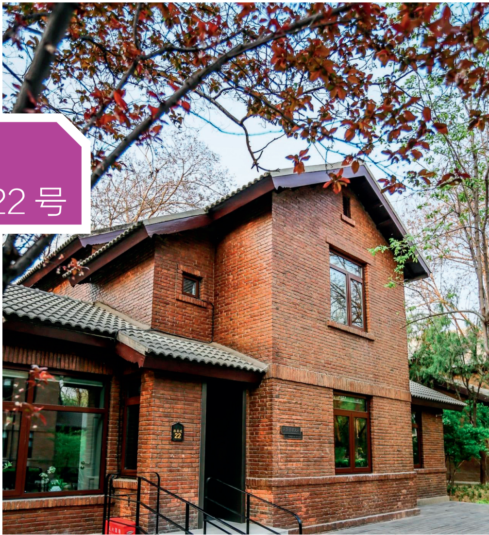
胜因院 22 号，“英华学者之家”

在照澜院西侧低调而古老的建筑群中有一片别具一格的房屋。乍一看，只是几排两、三层小楼坐落于宽阔的院落，房屋墙体的颜色和周围的建筑融为了一体，颇为不起眼；走近一观，却发现错落的三角型屋顶、房屋和植被的格局、整齐中带有变化的道路，无一不透露着设计感。这便是胜因院，始建于 1946 年，时任清华大学建筑系教授的林徽因曾亲自参与设计，梁思成、林徽