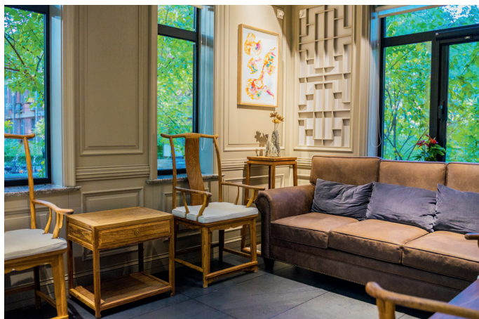
Reception Hall (会客室), 可容纳 2~6 人