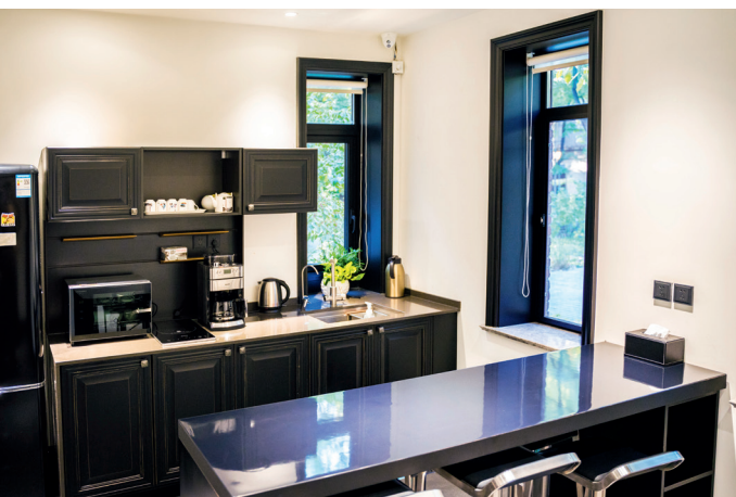
Lounge (咖啡吧), 可容纳 5~10 人 咖啡、茶水均免费提供给参加活动的师生

相同的智能教学设备,不同的是此处几乎没有桌椅,更加适合观影以及需要进行室内走动的活动。太空舱内举办最多的活动名为“光影立方”,来自全球胜任力发展中心的举办者放映代表各国文化气质的电影,随后与同学们一同讨论、分享感受。太空舱旁边有一个非常小的空间,人站在此处可以看到下面的楼梯和墙上挂的照片,每一个空间都不乏味,给人豁然开朗的感觉。