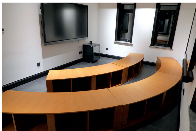
Arena (会议室), 设计座位 16 个, 可容纳不超过 20 人