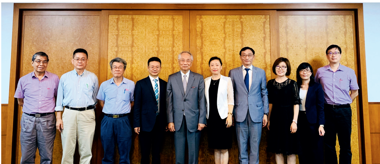
聘任仪式上的合影

“清华学生是民族的菁英分子，国家未来的栋梁，我期盼清华学子在校努力学习，未来为社会、为国家、为人类贡献更多力量。”