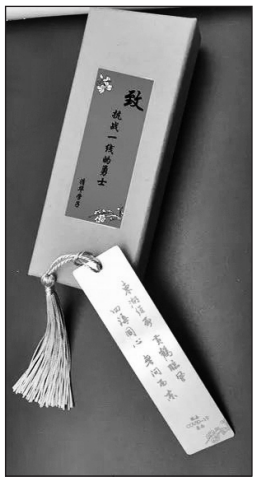
爱心书签致敬抗疫天使 一九九三级校友精心制作

华资本捐赠杜邦防护服29700件。还有多家校友企业捐赠了医用净化器、呼吸机、乳胶手套、消毒液等物资，极大填补了医用抗疫物资的缺口，为疫情防控贡献了重要力量。