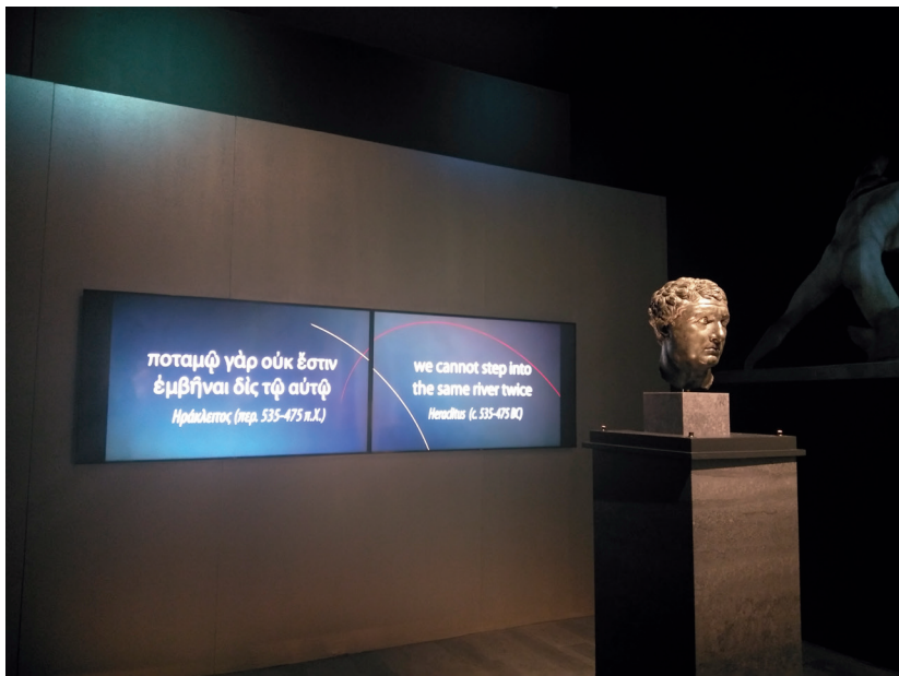
赫拉克利特的名言：人不能两次踏进同一条河流

前，看着空寂的洞，洞口岩石上还有水滴不时滴下，思接千载，的确也是“有一种非常奇特的感觉笼罩着我”，感到既乐又静，倏忽间穿越时空见到先哲的影子，体悟到民主与法律的味道。