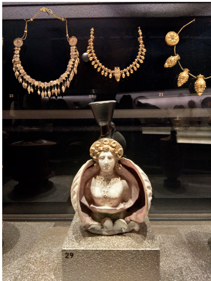
博物馆里的古希腊展品精美绝伦