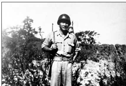
从军的喜悦——1944年2月，父亲与15名清华同学一起经驼峰航线加入远征军驻印军，图为父亲戎装照