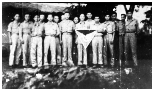
母校的深情——在印缅战场，为庆祝联大校庆，父亲与同学们举着用纸版画出的联大校徽合影留念