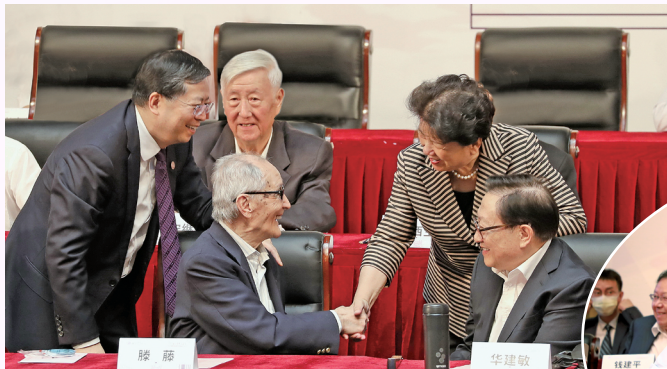
▲ 邱勇、安继刚、滕藤、陈至立、华建敏会前亲切交谈

9月26日，清华大学核能与新能源技术研究院建院60周年总结纪念大会在新清华学堂隆重举行。来自国家部委、高校、企事业单位代表和校内师生代表近500人齐聚一堂，共同回顾核研究院历史进程，共话核研究院未来发展。