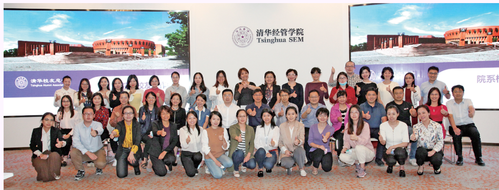
▲ 校友总会召开2020 年第一次院系校友工 作会