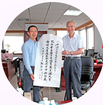
▲ 电机系领导看望金怡濂院士（左图，中）和张履谦院士（右图，右）