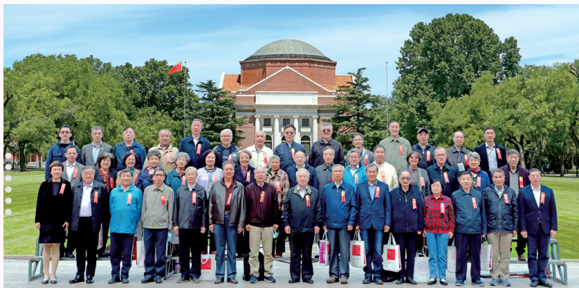
◀ 1970届校友 毕业50周年 座谈会召开