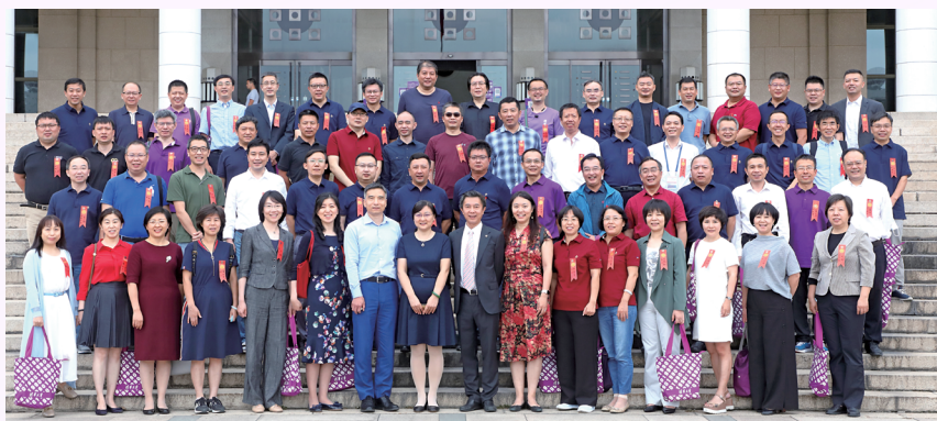
▶ 1990级入学三十 周年纪念大会举行