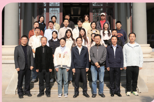
▲ 江西校友会2025年迎新座谈会举行