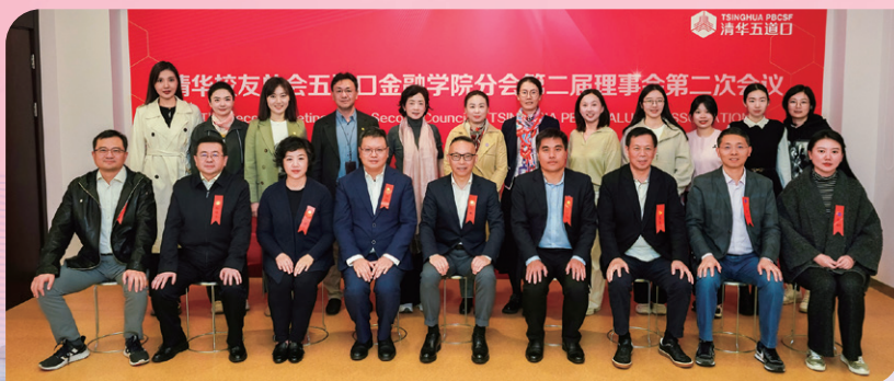
◀ 五道口金融学院分会第二届理事会第二次会议召开