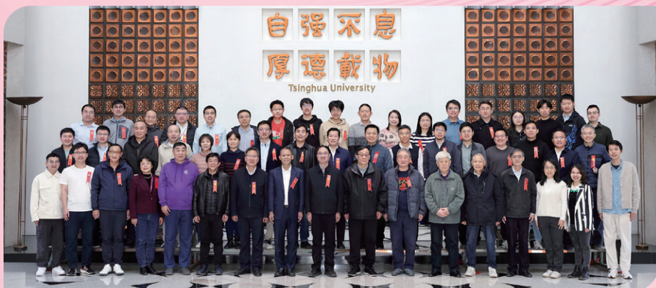
▲ 清华校友总会自动化系分会举办2025年会员代表大会、第四届理事会第一次会议