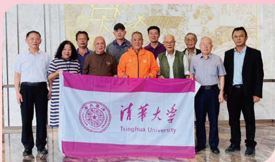
▲ 汕头校友会举办重阳节茶话会