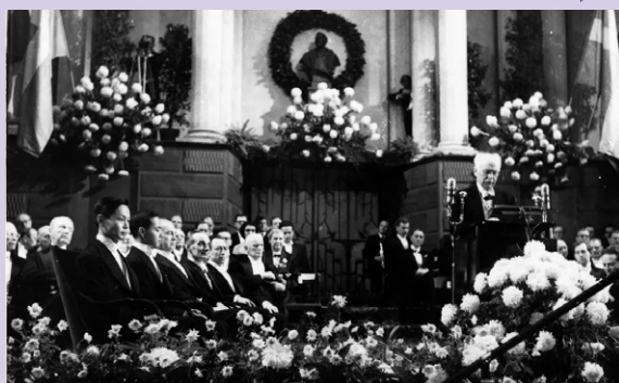
▲ 1957年诺贝尔奖颁奖现场。前排左1为杨振宁，左2为李政道