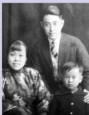
一九二九年，杨振宁 与父母亲在厦门

杨振宁（1922年10月1日—2025年10月18日），享誉世界的物理学家、诺贝尔物理学奖获得者，中国科学院院士，清华大学教授、清华大学高等研究院名誉院长。他与米尔斯提出的“杨-米尔斯规范场论”、与李政道合作提出的“弱相互作用中宇称不守恒”革命性思想、发现的“杨-巴克斯特方程”及在粒子物理、凝聚态物理等物理学多个领域取得的诸多成就对现代物理学的发展作出了卓越贡献。