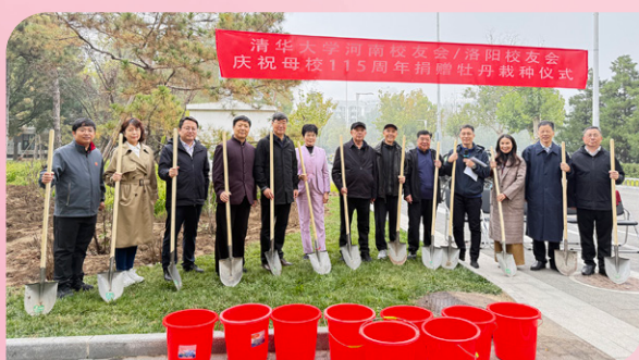
▲ 河南校友会与洛阳校友会联合发起的“庆祝母校115周年捐赠牡丹栽种仪式”在清华园举行