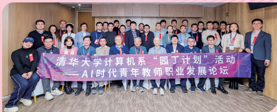
▲ 计算机系“园丁计划”活动——AI时代青年教师职业发展论坛举行