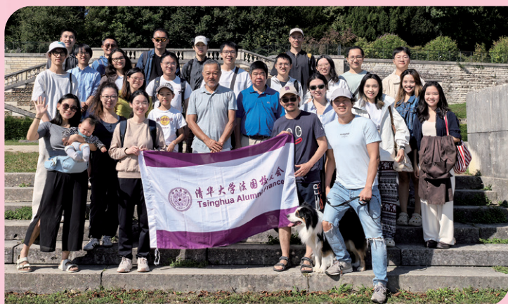
► 法国校友会2025迎新活动举行