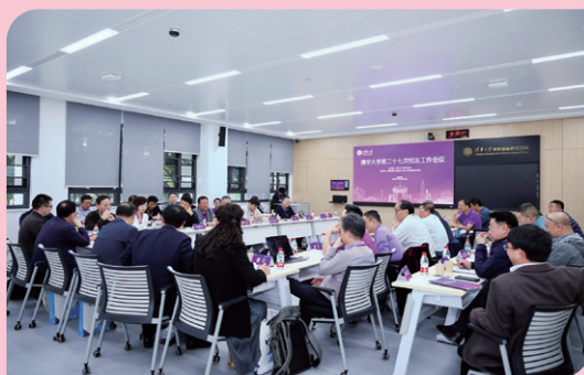
▲ 校友工作分组研讨现场