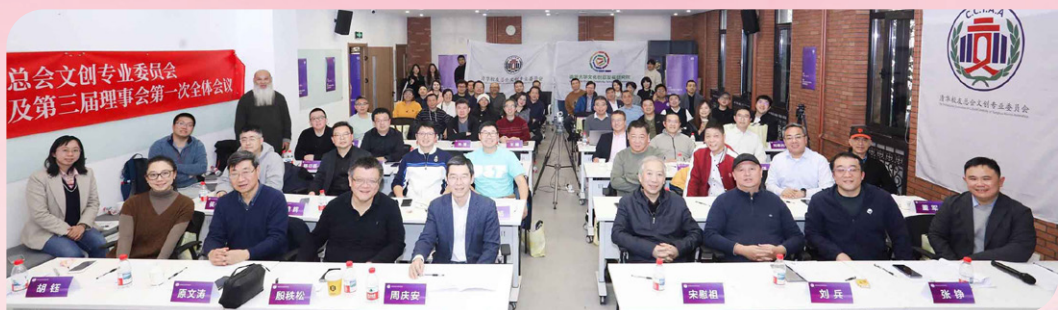
▲ 清华校友总会文创专委会第三次会员大会及第三届理事会第一次全体会议召开