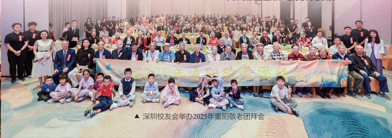
▲ 深圳校友会举办2025年重阳敬老团拜会