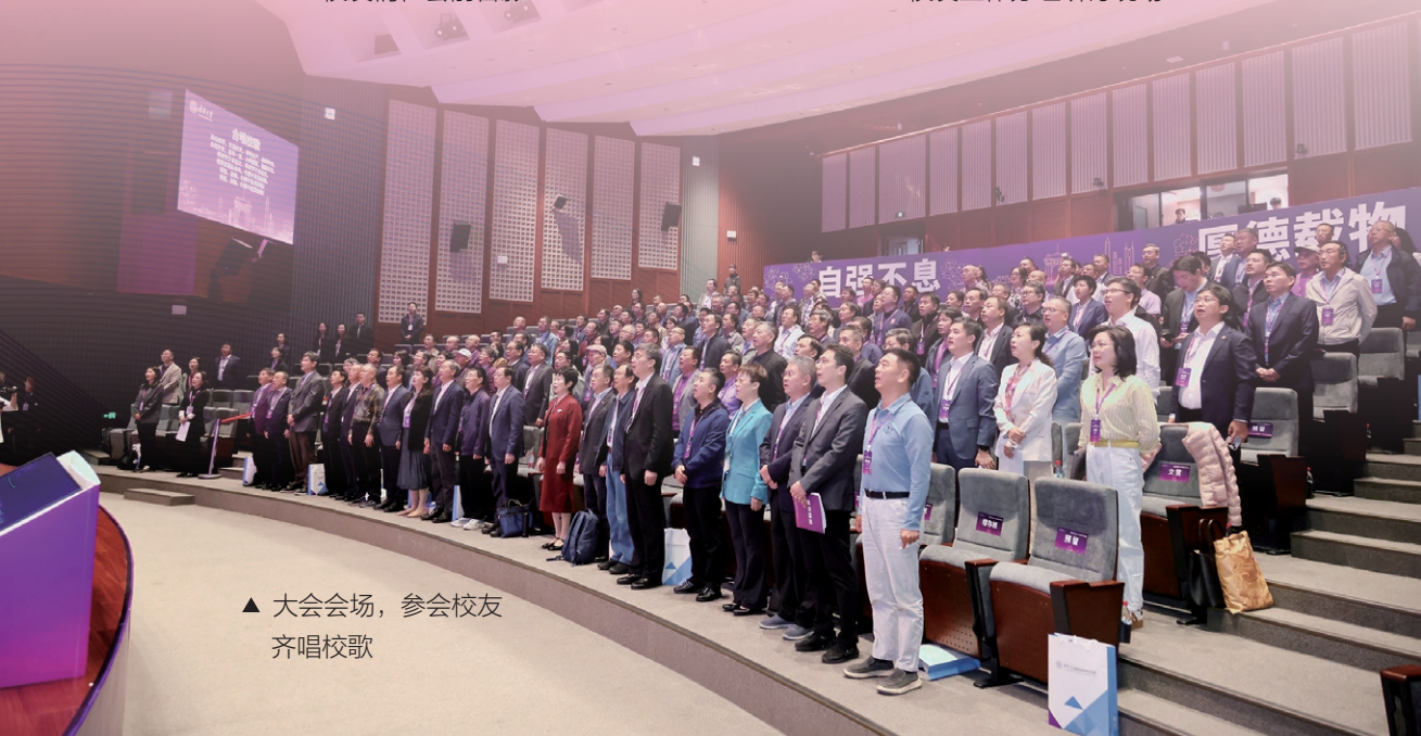
▲ 大会会场，参会校友齐唱校歌