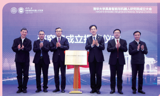
▲ 清华大学具身智能与机器人研究院成立大会举行