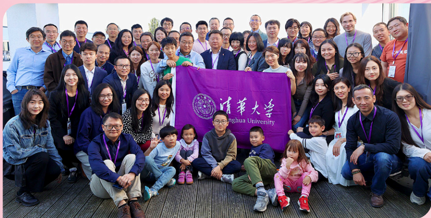
▲ 第二十二届德国校友会年会在柏林举行