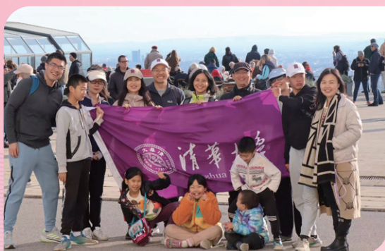
▲ 奥地利校友会秋季徒步活动举行