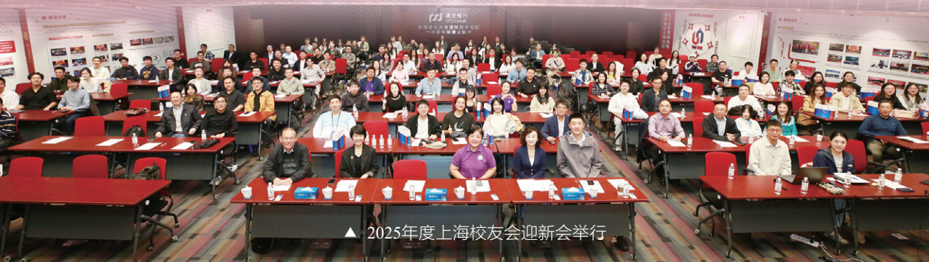
▲ 2025年度上海校友会迎新会举行