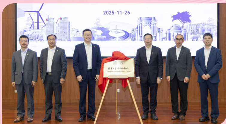
◀ 清华大学非洲中心揭牌