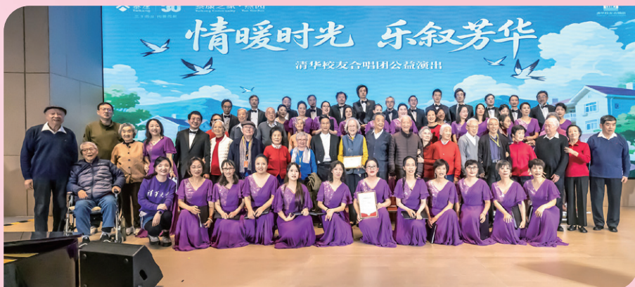
▲ 清华校友合唱团赴泰康之家·燕园养老社区公益演出