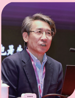
▲ 薛其坤院士作主题报告