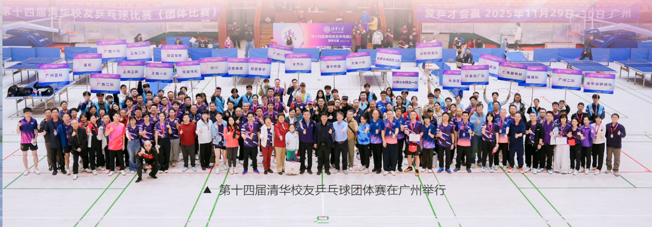
▲ 第十四届清华校友乒乓球团体赛在广州举行