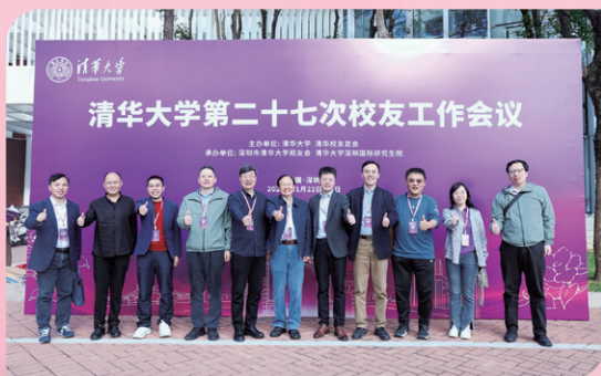
▲ 校友们在会前合影