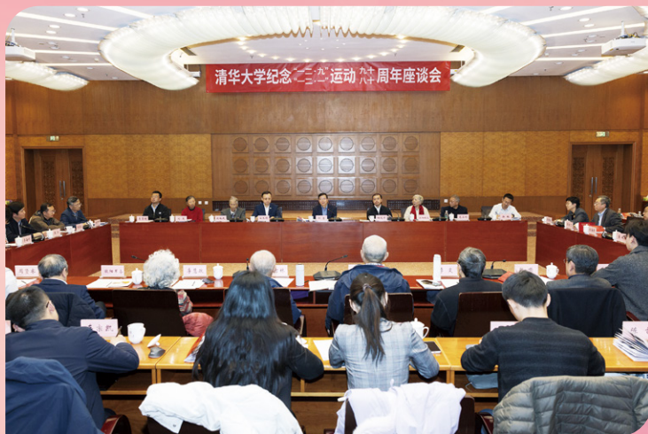
▲ 清华大学纪念“一二·九”运动90周年、“一二·一”运动80周年座谈会举行