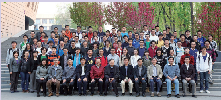
◀ 杨振宁与清华学堂物理班合影

▼ 2025年10月24日，杨振宁先生遗体告别仪式在八宝山革命公墓礼堂举行，党和国家领导人、清华师生校友和各界人士前往送别