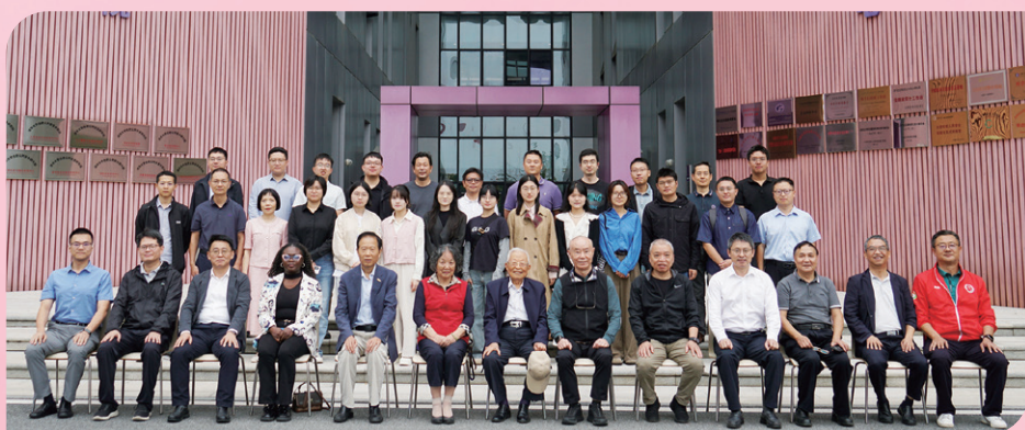
▲ 安徽校友会2025年迎新活动举行