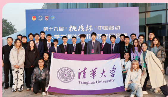
▲ 清华大学获得第十九届“挑战杯”全国大学生课外学术科技作品竞赛冠军