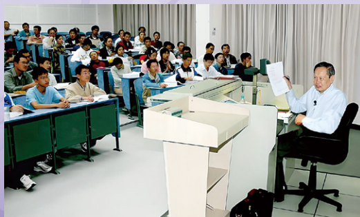
▲ 杨振宁给大一学生讲普通物理

▼ 2025年10月24日，杨振宁先生遗体告别仪式在八宝山革命公墓礼堂举行，党和国家领导人、清华师生校友和各界人士前往送别