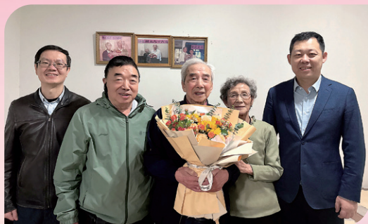
▲ 天津校友会重阳节走访慰问老校友