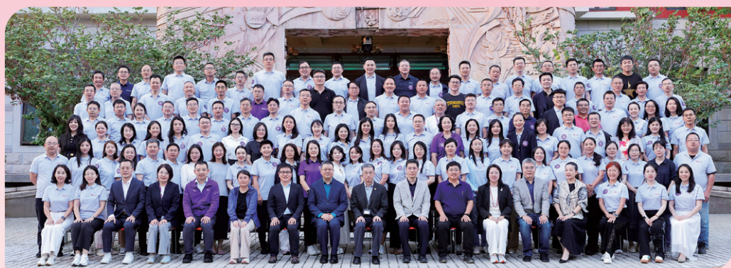
▲ “清华校友终身学习支持计划·金融班”结业仪式举行