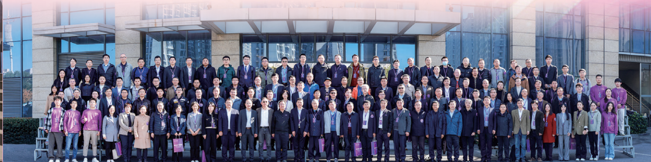
▲ “清华大学9003+”精密仪器系校友大会暨智能光电科技产业融合发展大会举行