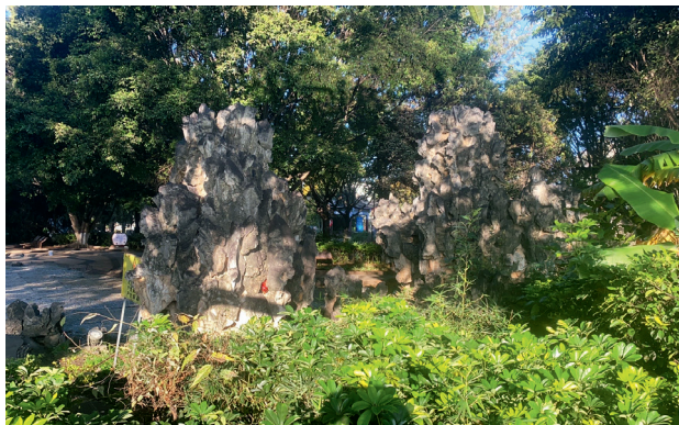
2025年12月到访南湖假山场景

“不久，终于在与哥胥士洋行仅隔一条马路的斜对面，南湖边上，看到一座大的假山。是的，母亲说过，那假山很大。快步过去，先看见一樽白色大理