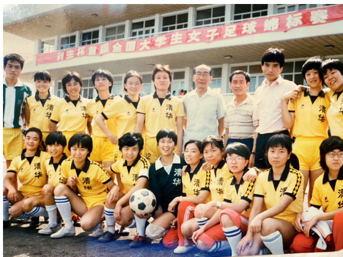
1988年首届利生杯参赛教练及队员合影