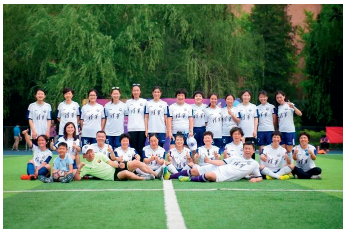
2018年校庆庆祝女足成立35周年及83级毕业30周年参赛队员合影