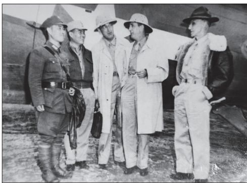
1944年初，曾锡珪（左1）与史迪威将军（右1）等在云南昆明巫家坝机场