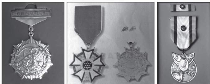
中国（2015年）、美国（1943年）、中国台湾（2015年）颁发的抗战胜利纪念章