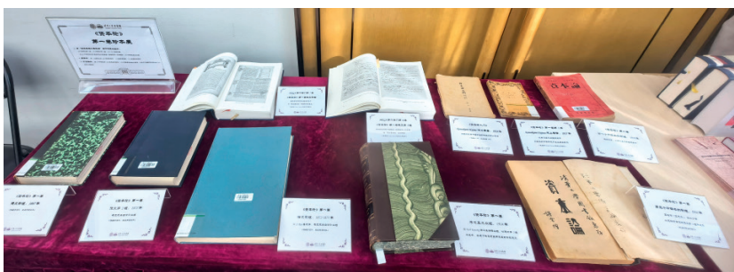
《资本论》第一卷珍本展