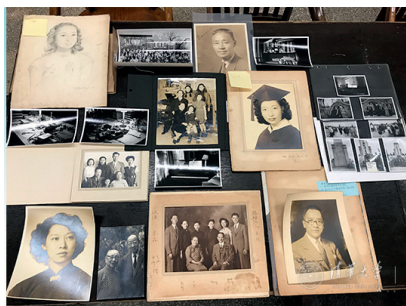
赵元任亲属捐赠的部分珍贵老照片