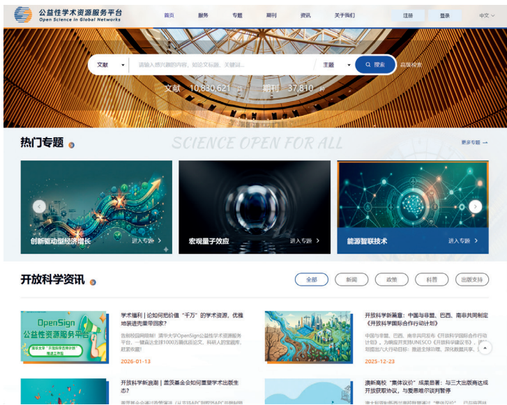
OpenSign 公益性学术资源服务平台

图”。这张图能清晰呈现该领域的学术起源、关键学者、标志性成果、重要学术争论及分支方向间的关联。这背后是我们正在构建的智能化信息基础设施。