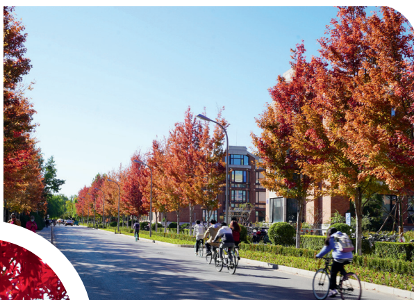
美国红枫 - 近春路