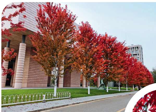
美国红枫 - 艺博

层次丰富而多变。当然，清华园里的秋叶红也少不了红枫、鸡爪槭。校园各处绿地中种植有不少红枫和鸡爪槭，不仅颜色红得正，叶形也精致好看，最适合捡来做成书签，秋天就被留住啦。