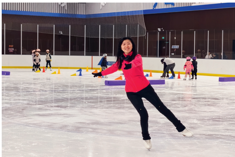
2026年1月于清华大学北体冰场

身体的灵活性和平衡能力也都得到了提升。在保持健美苗条的身材方面，我更是有了足够的信心。其实如今让我热爱花滑的还有一个非常重要的原因，那就是因为我是一名钢琴和古典音乐爱好者（大学时是文艺社团键盘队成员），我特别迷恋那种一边戴着Bose耳机听着喜欢的音乐、一边随着韵律起伏舒展身体的感觉，那种灵魂伴着音符一起在冰面上自由飞翔的陶醉……花滑带给我的这种全身心的沉浸式快乐是任何其它运动都无法替代的。