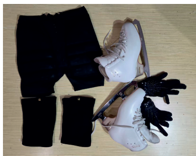
重上冰面后采购的花滑鞋和护具

没上冰了，现在已经年过半百，万一摔骨折了怎么办？幸运的是，现在有卖各种滑冰护具，比我们当年条件强多了。于是我抱着试试看的心态，网购了冰鞋和护臀、护膝，在时隔多年后，再一次踏上了久违的冰面。于是那一次，在清河万象冰纷的冰场上，我结实实地摔了四个大跟头，为自己二十多年与冰面的疏离买了单。不过我惊喜地发现，有了护具的