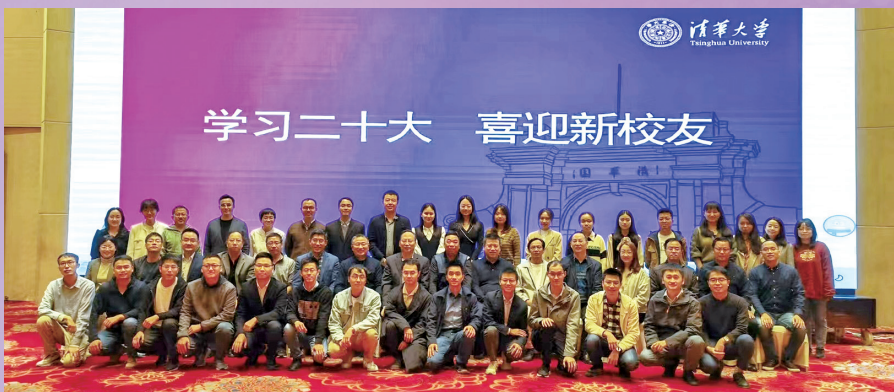
▲宁波校友会举办2022年迎新活动