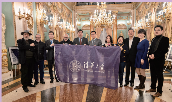
▲第二届欧洲清华校友大会摄影作品展在意大利佛罗伦萨博尔盖塞宫开幕