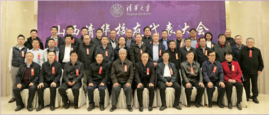
▲山西校友代表大会举行