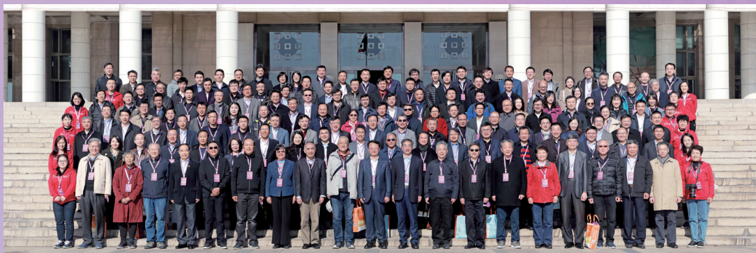
▲现场参会人员合影