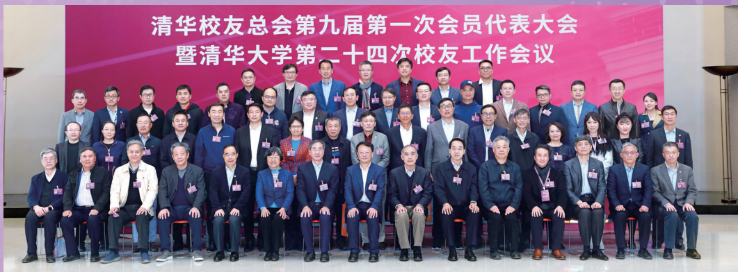
▲校友总会第九届理事会第一次全体会议现场参会理事合影