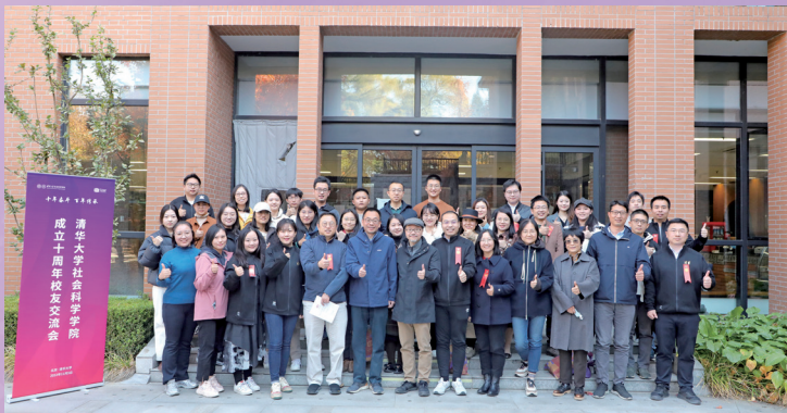
▶ 社科学院成立十周年校友交流会举办