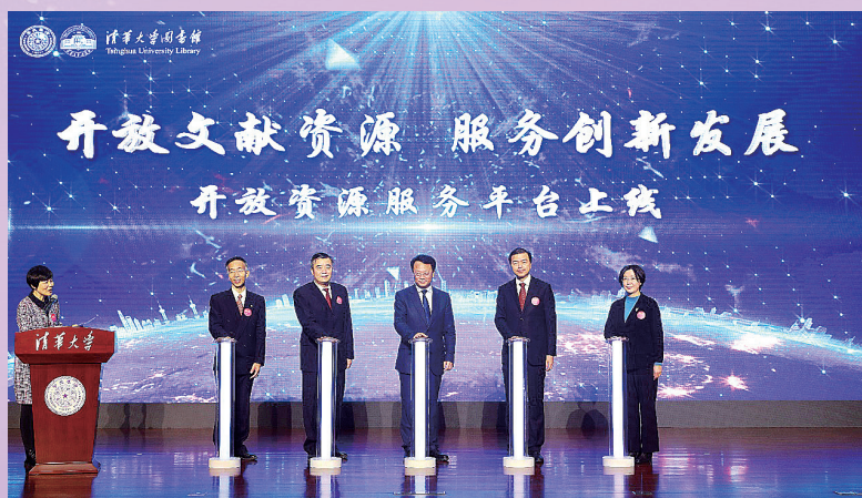
▲ 清华大学图书馆建馆110周年庆祝大会举行，正式发布开放资源服务平台