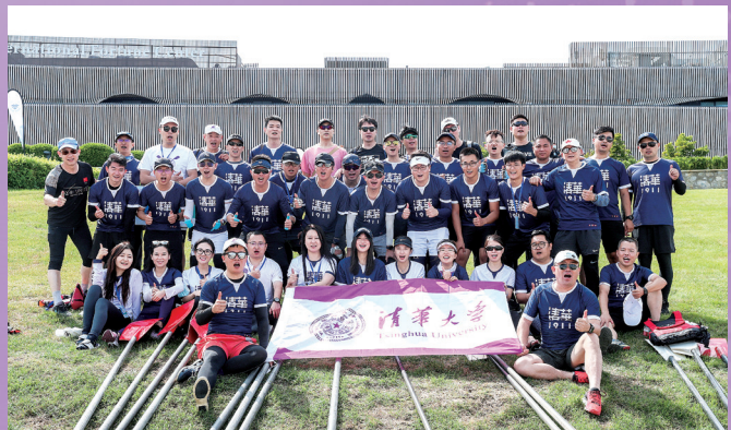
▶ 清华校友水上运动协会参加2022北京城市副中心运河赛艇大师赛斩获佳绩