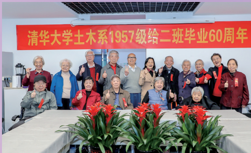
▲ 给二班毕业60周年聚会