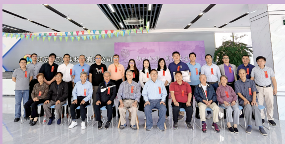
▲南通校友举办年度联谊活动