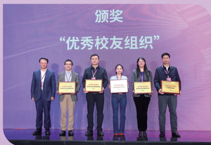
▲颁发优秀校友组织奖