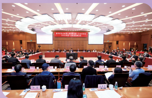
▲第九届理事会第一次全体会议现场