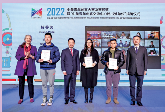
▲ 2022中美青年创客大赛落幕，清华团队捧得全国特等奖