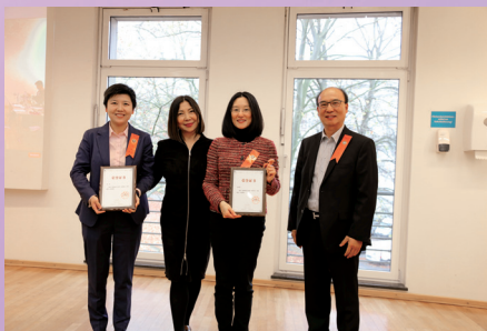
▲颁发优秀校友工作者奖