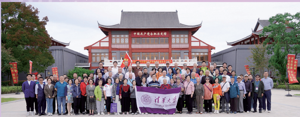
▲安徽校友会组织2022年重阳节校友活动暨功能型党支部活动