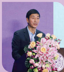
▲唐杰作第八届理事会 工作报告