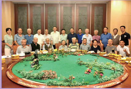
▲广西校友会国庆重阳双节慰问老学长