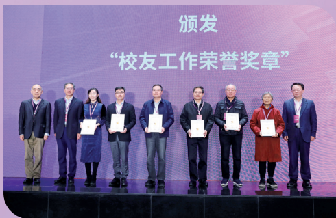
▲颁发校友工作荣誉奖章