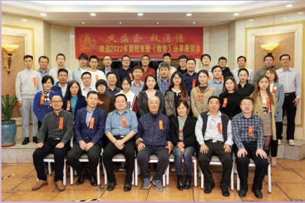
▲天津校友会欢迎2022年新校友