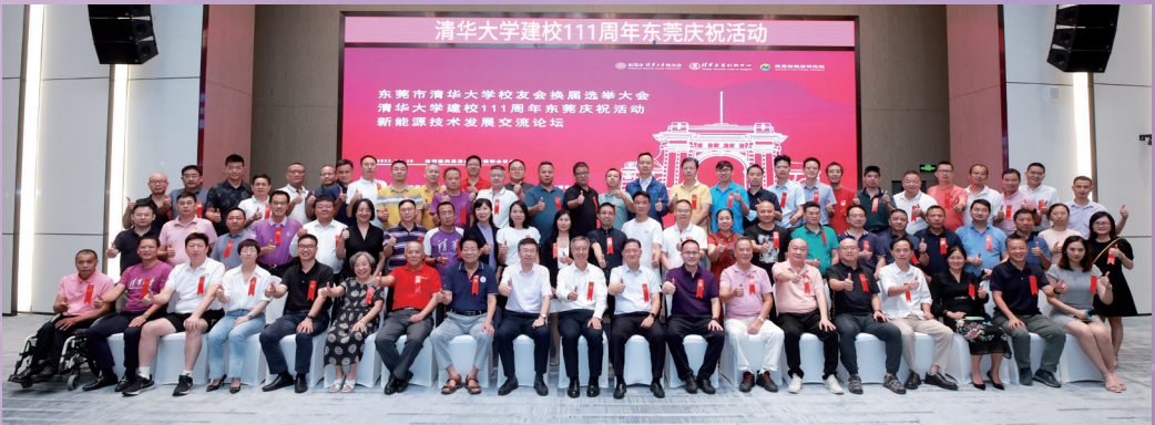
▲东莞校友会举行换届大会暨清华建校111周年庆祝会