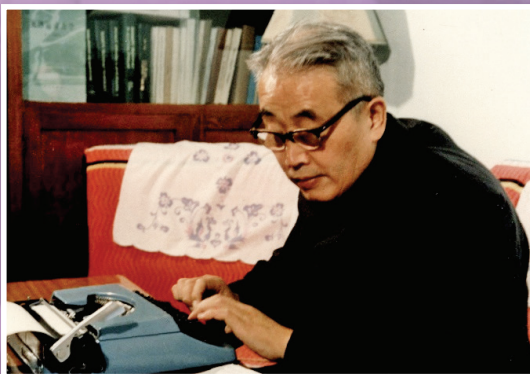
▲病中在家坚持工作，用英文打字机打印学术文稿（1983年）