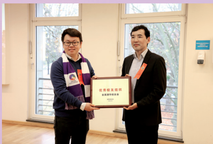
▲颁发优秀校友组织奖