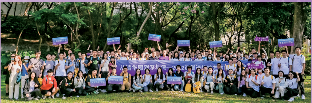
▲2022深圳清华校友迎新日活动举办