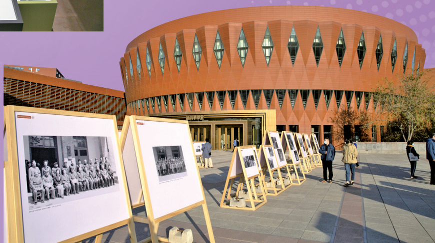
▶ “张祖道镜头下的清华”展览举行