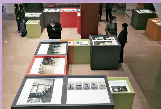
▲ 赵元任诞辰130周年纪念展览揭幕