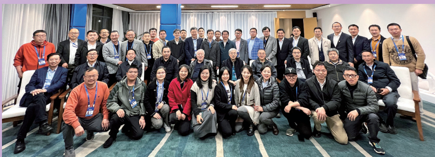
▲云南校友会与院士专家座谈联谊