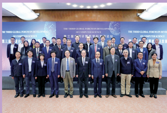
▲ 清华大学举办第三届全球计算机学科发展论坛