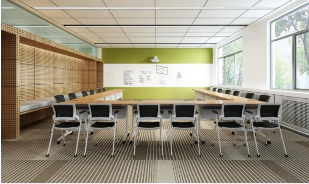
图 5 三教普通教室