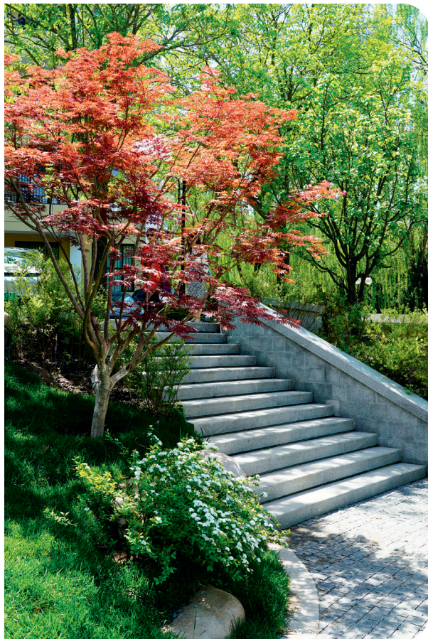
自然野趣的植物搭配