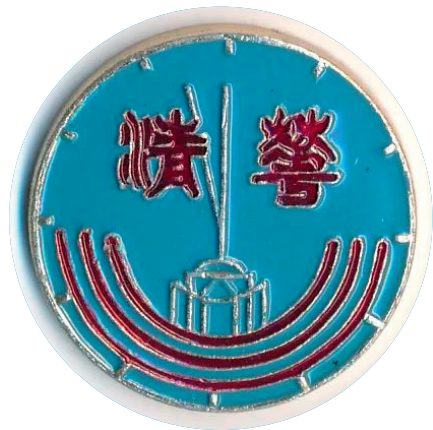
1987版体育锻炼纪念章

我的大学冬泳始于1986年的大三开学不久，当时我对游泳充满热情，天天去校园里的西湖游泳池。随着秋天到来，天气转凉了，露天的西湖游泳池正式对外开放也要结束了，想继续游泳就得办个冬泳手续，手续就是交费