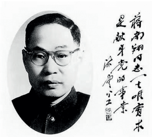
陈云为蒋南翔题词：“蒋南翔同志一生唯实求是献身党的事业”。

1952年，中央决定对我国高校的院系进行调整，并决定将清华改为工业大学，调蒋南翔担任校长。他原来是清华中文系的毕业生，上任前他跟人说：“我边干边学，我去学成一个工业大学的普通学生