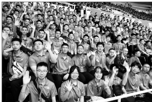
新生参加开学典礼

2023年，我作为学术牵头人，与中国北京代表团的同仁们一起在哥本哈根申办成功，让世界建筑师大会在2029年再次回到北京。而这其实只是清华众多的国际交流合作当中的一个普通例子。在今天不确定性增加的世界，气候变化、人工智能变革、社交媒体时代的价值观冲突等挑战此起彼伏，我们总是能够听到清华各学科在世界舞台上发出的中国声音，我们也总是能日益感知到世界上对更多的中国声音的期待。今年学校决定成立的紫荆书院，正是以清华本科教育的国际化建设推进中国高等教育国际辐射的重要举措。作为紫荆书院建设的全程参与者，我的一点不成熟的观察是，如果说改革开放初期我们的国际化是从“知己”到“知人”——也就是向西方发达国家学习，那么今天我们要从“知人”到“知众生”——也就是要