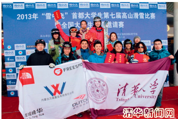
2013年首都高校高山滑雪比赛中清华滑雪队包揽全部冠军

天雪地里一遍遍刷道，琢磨每一个弯的细节；晚上聚在一起研究过门路线与技术，分析战术。手脚冻僵、脸颊皴裂是家常便饭。但没有人抱怨，因为所有人都清楚，我们代表的不再仅仅是个人爱好，更是清华的荣誉。