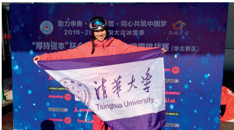
首届全国大学生滑雪挑战赛华北赛区高山滑雪女子双板大回转冠军

北影、中青政、外经贸等高校成立北京高校高山滑雪协会联盟，让更多志同道合的伙伴加入，参与到滑雪运动中。正是在这样的背景下，雪协联盟从松散的交流走向制度化的联盟，我们一起制定规则，一起筹办比赛，让高校滑雪无论从爱好还是竞技都走上了规范化、可持续的道路。