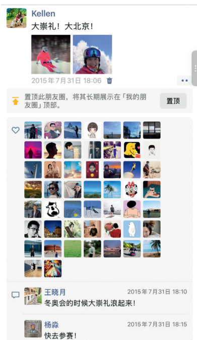
2015 年 7 月 31 日北京申冬奥成功的朋友圈