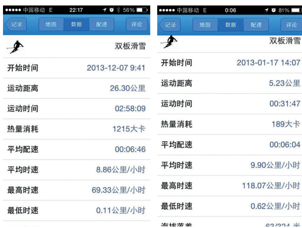
2013年只有2G网络时手机app记录的滑行数据

滑雪社团。滑雪,在当时的高校里,是名副其实的“高冷”运动——成本高、门槛高、知晓度冷。