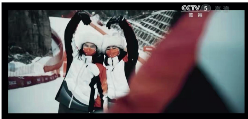
荣登央视 2022 冬奥宣传片

单的快乐。或许，所有深刻的热爱，最初都源于一份纯粹的好奇与喜悦。那片种在心里的雪花，虽然微小，却从未融化。