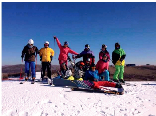
2013年清华滑雪队第一次崇礼万龙滑雪场集训留念