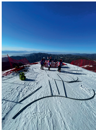
冬奥起点搭建准备工作