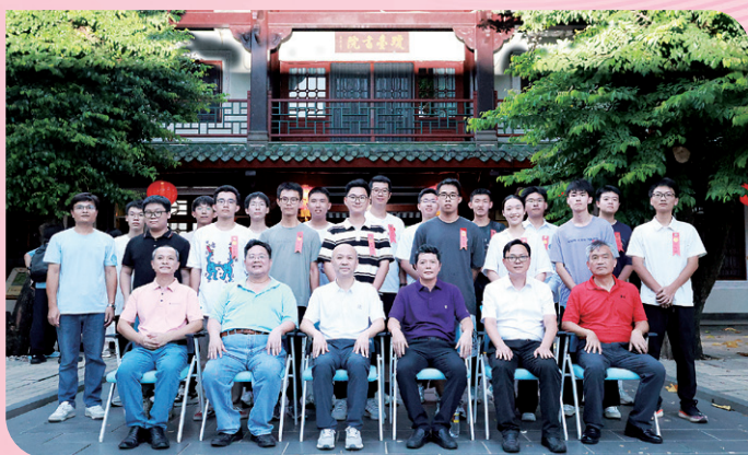
▲ 海南校友会2025年送新生座谈会举行