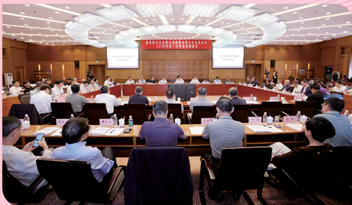
◀ 清华校友总会第九届理事会第七次全体会议举行