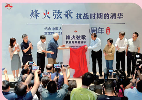
▲ “烽火弦歌——抗战时期的清华”专题展开幕