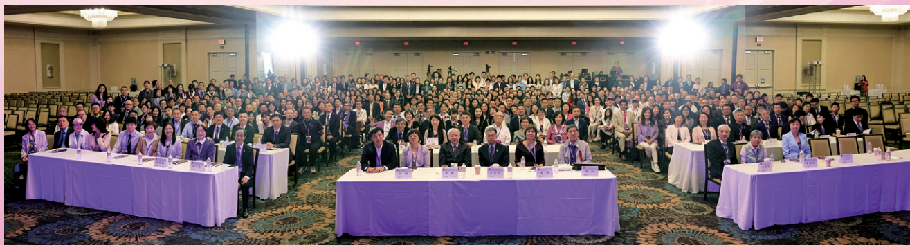
▲ 第六届北美清华校友大会举行