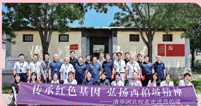
▲ 石家庄校友会开展七一走进西柏坡活动