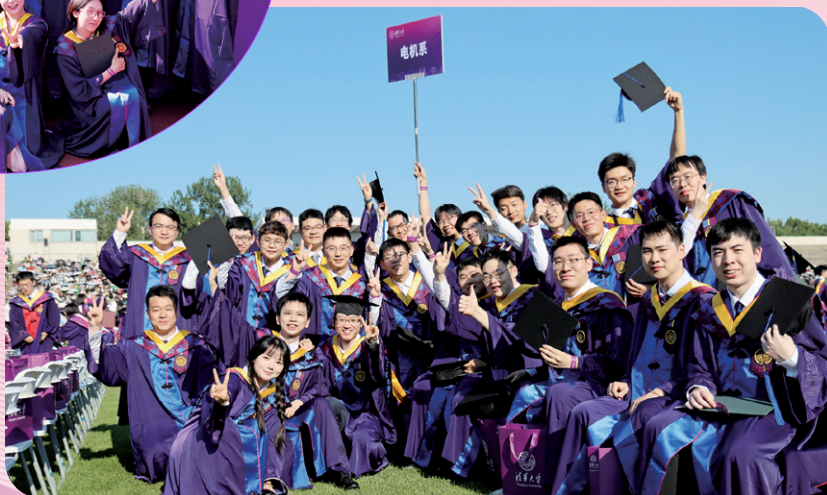
► 我们将踏上新的征途