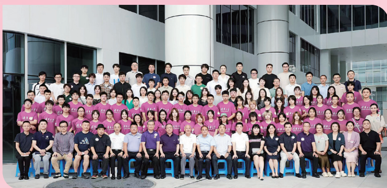
◀ 四川成都校友会2025迎新送新会举行