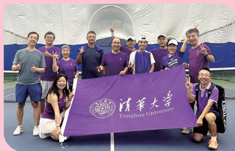
▲ 美国马里兰州2025梅竹松网球团体赛落幕，清华队重夺冠军