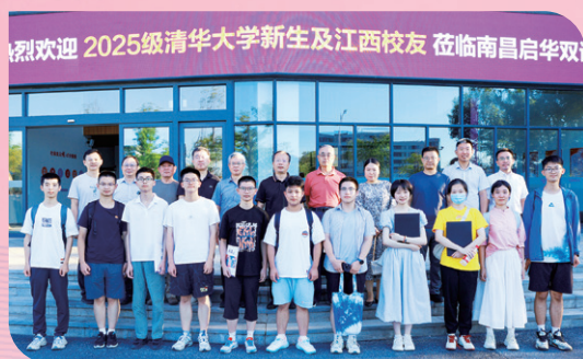
▲ 江西校友会2025送新座谈会举行