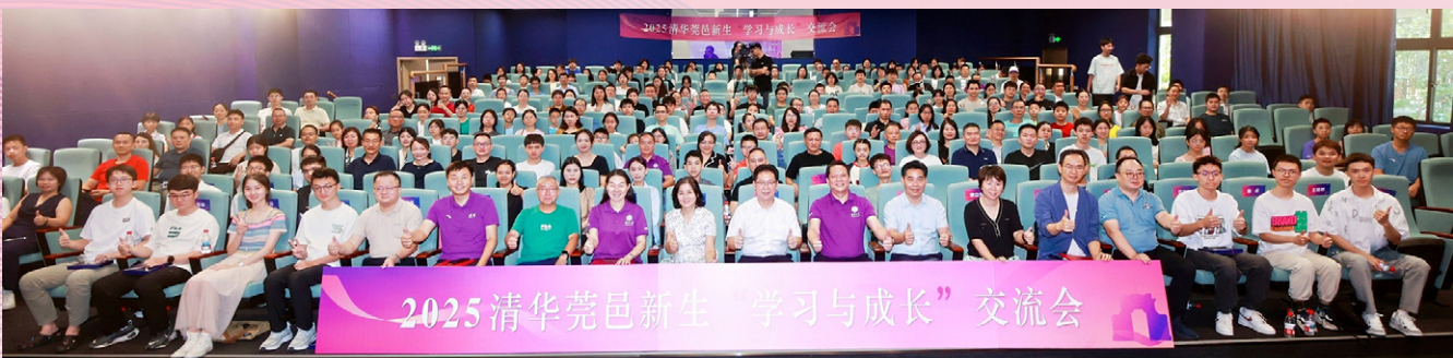
▲ 2025清华莞邑新生“学习与成长”交流会举行