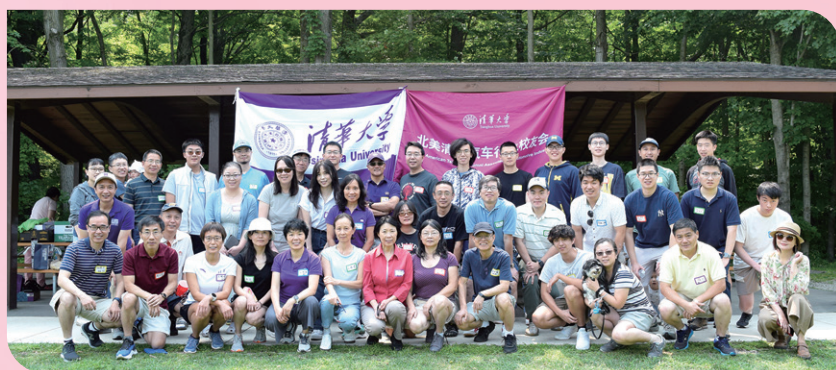
▲ 密歇根校友会举办2025夏季校友聚会