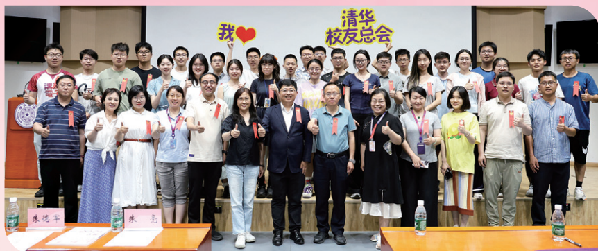
► 清华大学2025届本科毕业生校友年级理事聘任会议举行