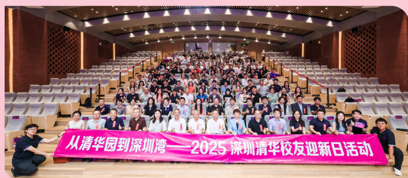
▲ 深圳清华校友迎新日活动举行