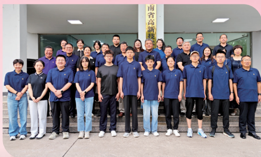
▲ 洛阳校友会2025送新生座谈会举行