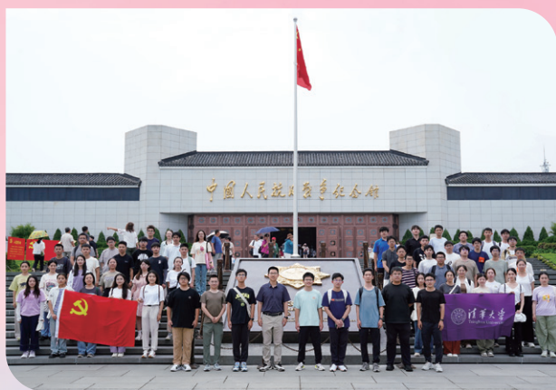
▲ 清华大学师生参观中国人民抗日战争纪念馆