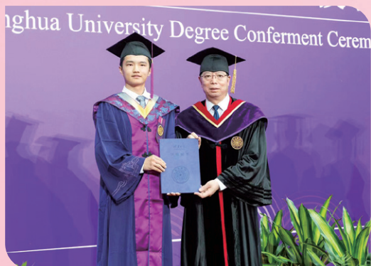
▲ 校党委书记邱勇为本科毕业同学颁发学位证书

6月21日上午，清华大学2025年本科生毕业典礼举行，3551人被授予学士学位。