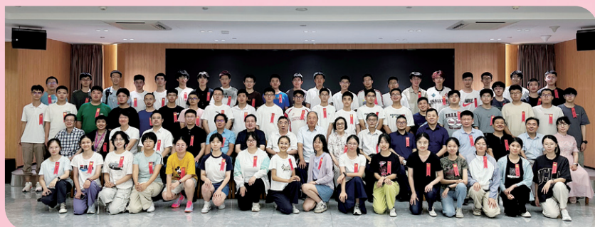
▲ 2025级天津新生与校友座谈会举行