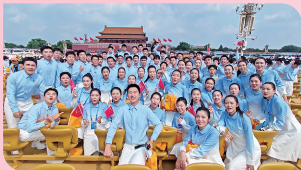
▲ 参加九三阅兵广场合唱团的清华大学师生合影

2025年是中国人民抗日战争暨世界反法西斯战争胜利80周年，清华师生深度参与九三阅兵，并以丰富多彩活动纪念抗战胜利。本刊选取部分活动图片展示，以志纪念。