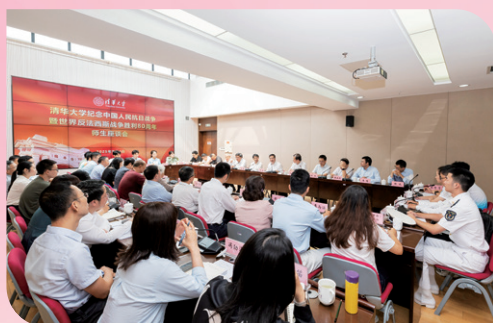
▲ 纪念中国人民抗日战争暨世界反法西斯战争胜利80周年师生座谈会召开