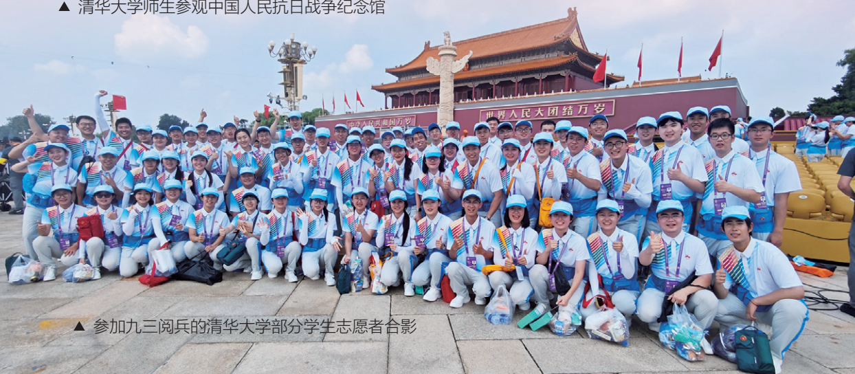
▲ 参加九三阅兵的清华大学部分学生志愿者合影