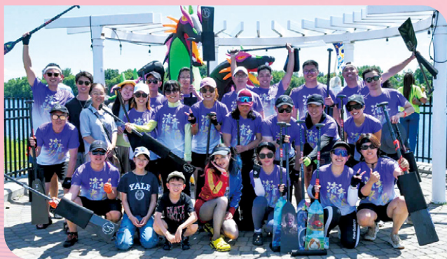
▲ 波士顿校友会青青快船队在2025 Springfield龙舟赛中勇夺季军