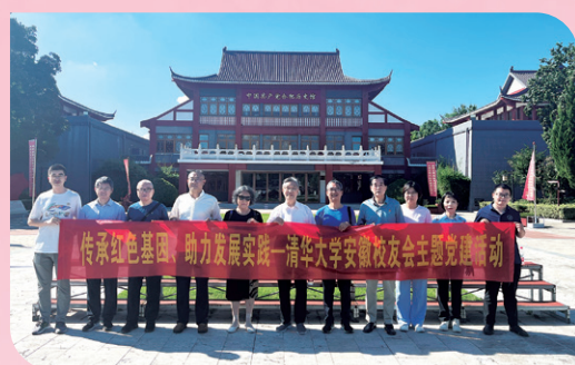
▲ 安徽校友会开展党建研学活动