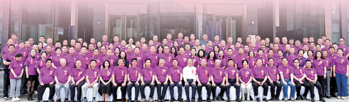
▲ 内蒙古自治区清华大学校友会注册成立大会举行