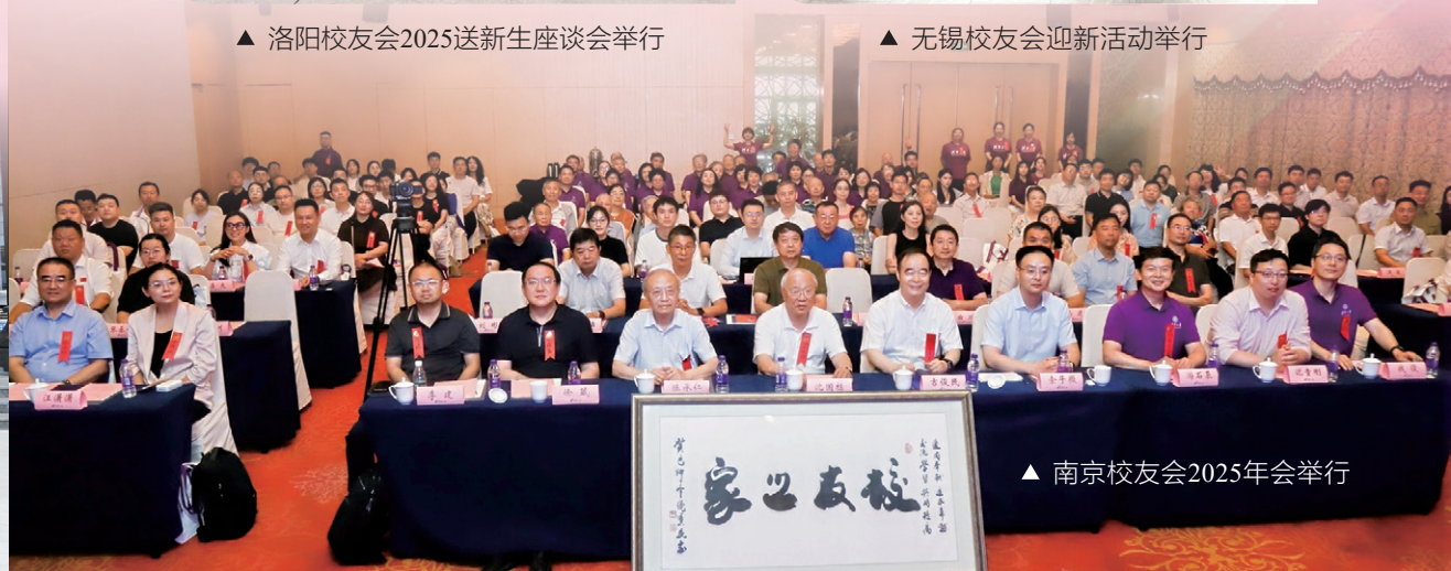
▲ 南京校友会2025年会举行