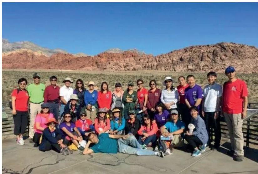
联谊会组织的徒步穿越大峡谷活动

只因拥有那份情怀，守着那份情谊，这些老队友们才能忘记年龄，一次次开怀大笑。回“家”真好，这个“家”真热闹！