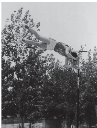
无论前路有多少拦路的险阻，用更高的飞跃战胜它！