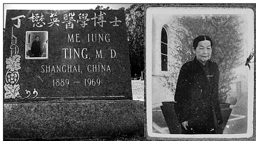
丁懋英的墓碑与遗像(位于美国加州圣马特奥县)

她在美国继续长期从事医学工作，直至生命尽头。1969年7月15日，她在纽约市参加一个医学会议时因心脏病突发而溘然长逝，终年78岁。丁懋英的长眠之地，