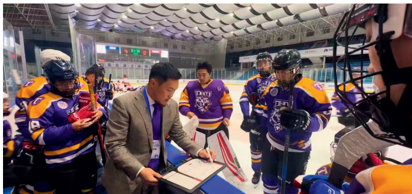
在 CUHL 全国大学生冰球联赛比赛执教现场

布局、以教育初心深耕，让冰球运动在高校落地生根、在青年中开花结果，用一点一滴的努力，逐步打破壁垒、厚植土壤，为中国冰球的长远发展注入来自校园、来自教育、来自青年的持久力量。