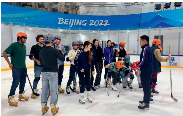
在2022年北京冬奥会冰场组织中外在校学生开展冰球普及活动