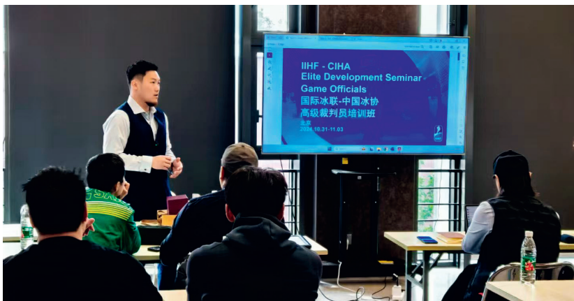
参加国际冰球联合会裁判员培训