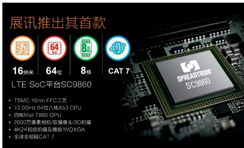
SC9860（展讯经典 4G LTE SoC，裸片 + 基板实拍）