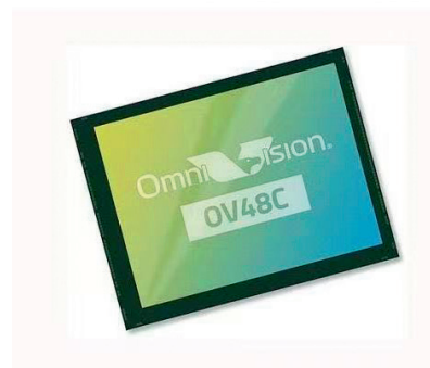
▲ 豪威科技 OV48C (经典旗舰): 4800 万像素手机主摄 CMOS (拆机实拍 常见型号) ◀ UDX710 5G 模块(通信壳拆解实拍)

1995 年全球只有 2-3 家初创公司开发 CIS。可 1996 年 2 月的世界固态电子电路大会 (ISSCC) 组织了一个介绍 CIS 的讲习班, 人满为患。此后半年内, 有 20-30 家公司杀进了这个领域, 包括 Intel、HP、Sony、National 等巨无霸, 每家都有几百人的团队, 投入几亿美金。一时间, 风云突变, 巨鳄环绕, 险象环生。相比之下, 我们 OVT 这“十几个人, 七八条枪”的草台班子实在不成比例。