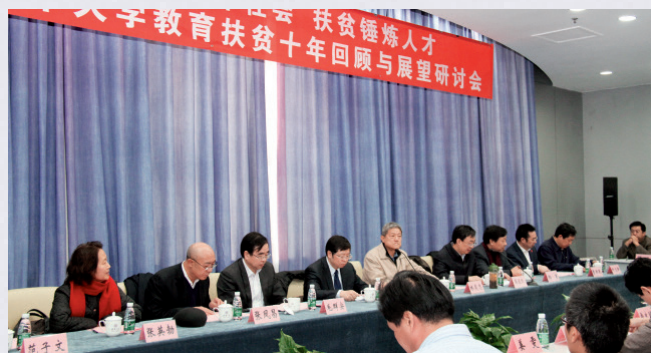
2013年12月，清华大学教育扶贫十年回顾与展望研讨会召开