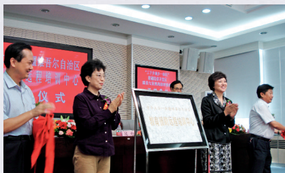
清华大学党委书记陈旭（右二）与时任新疆维吾尔自治区副主席靳诺（左二）为清华大学教育援助新疆维吾尔自治区远程培训中心揭牌

每年无偿提供的各类远程及面授培训课程近3000学时，内容涉及干部培训、中小学教师培训、农民培训等等。2004~2014年，清华大学共组织2080名清华学生利用暑假奔赴贫困地区开展英语教学、计算机教学、学习经验交流、社会实践等活动，2006~2014年还吸引了709名美国、英国及港澳台地区学生参与其中。