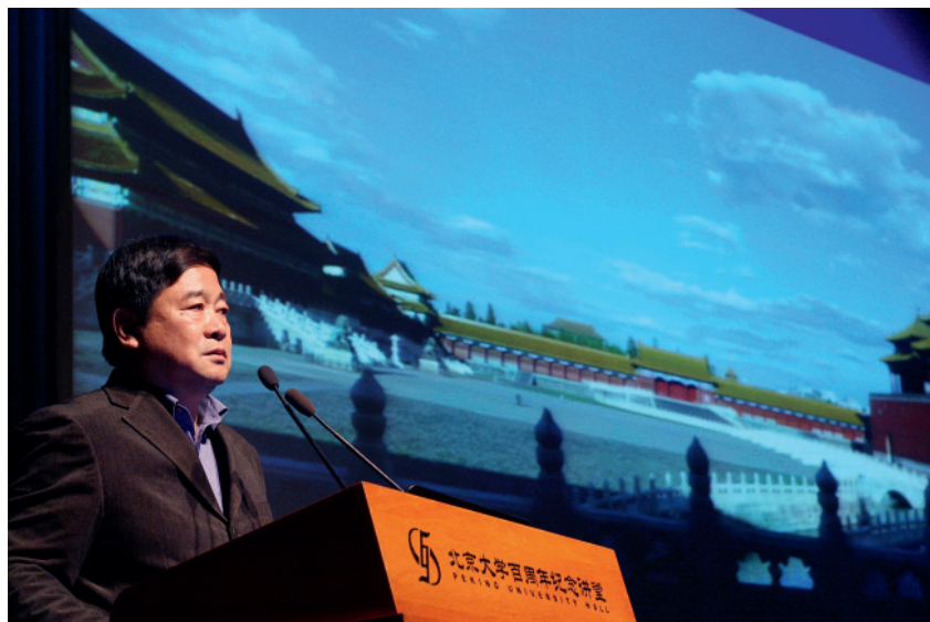
在北京大学百年讲堂上，单霁翔说，要“把壮美的紫禁城完整地交给下一个600年”

“墙壁要整洁”，是单霁翔今年的目标。“故宫古建筑有些墙体是残破的，没有尊严。”故宫博物院已着手整治两处“脏乱差”地方，一是内务府旧址，二是南大库，这两个地方长期施工堆料，现在要恢复它们的历史景观。除墙面外，单霁翔对地面也有规划。故宫目前仍有大量水泥地面、沥青地面，预计用三年时间改成传统砖石地面。伴随地面改