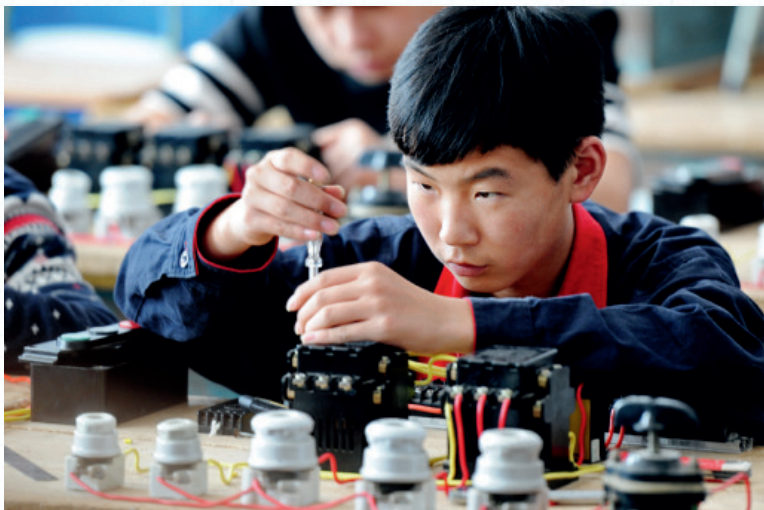
技术工人比例不增反降

界各国的就业群体中都是最重要的劳动群体，即使在完成现代化转型的发达国家，一般也占到全体劳动者的 10%~20% 多之间。所以，在中国未来社会结构中，仍然会占有重要地位，仍然是推动中国经济发展的最重要的群体。对于蓝领工人，我们同样要尊重他们的社会地位。其中的绝大多数目前被称为“农民工”，这种称谓有问题，他们是最为典型的产业工人、是工人阶级中最为基本的群体。体力劳动工人的工作特点是劳动强度大、劳动艰苦、劳动危险性大、劳动环境差，而目前待遇较低，所以，应该提高该群体的劳动工资、经济收入。从国际比较看，在完成现代化转型的国家，这个阶层的收入不亚于普通中产阶级的收入，而且由于工会力量强大，他们的收入甚至会高于一般中产阶级的收入。