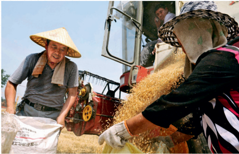
农民群体 10 年间减少了 16.71%