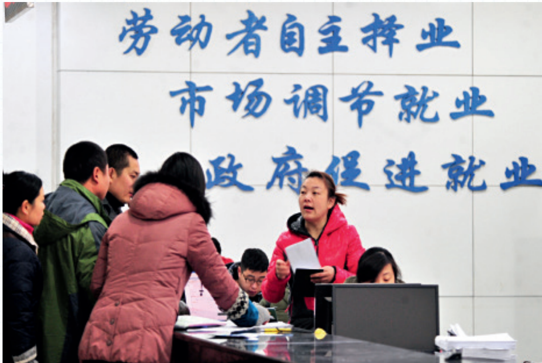
2015年，一些求职者在返乡农民工招聘会上

年劳动力为主。外出打工农民的情况更为复杂，一方面，循环流动的现象依然存在，即一部分中年以上的打工农民又返回家乡；另一方面，年轻农民返乡的可能性明显降低。六普数据显示的种田农民的比例下降是真实的，是不可逆转的。第三种是就地城镇化。调研发现，中国即使是留在农村没有外出的农民，有很高比例也不从事农业生产劳动了。这部分农民既没有转变户籍身份，也没有到城里打工，因而也不是城市流动人口或城镇常住人口。但是，他们早已不从事农业劳动，住房形态也发生根本变化，农民“上楼”已经成为普遍现象。这些村庄以及村庄周边非农产业十分发达，多数农民从事了工商业、服务业劳动。这些村庄已经与城镇没有差异。