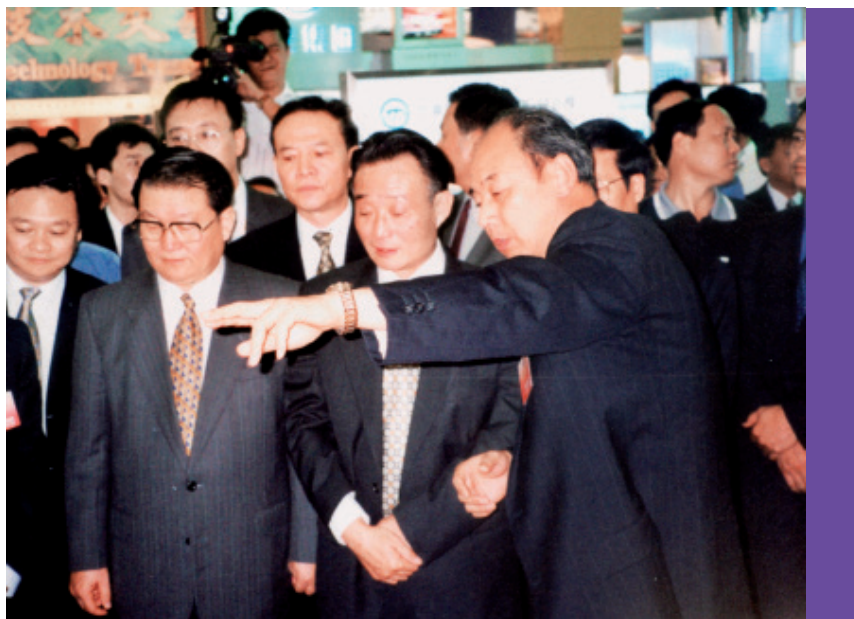
2000年10月12日第二届深圳高交会上,梁肃(右)向吴邦国,李长春介绍天津展品

工业发展要加快结构调整,加快企业改制步伐,促进新兴产业发展的思路和举措。在他和全市人民的努力下,天津的科技工作有了长足的发展,根据国家科委和国家统计局每年的测评,天津市综合科技实力从1993年的第7位,连年跃升,1997年上升到第4位,1998年跃升到全国第三,实现了进入国内第一梯队的目标。