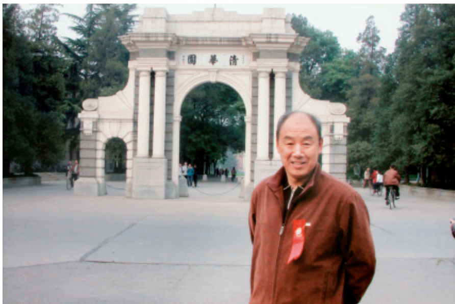
2008年校庆，在二校门前留影