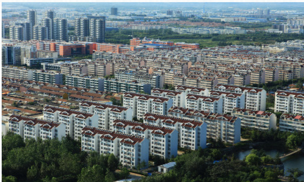
中国正在从一个传统农业大国剧变为现代城市型国家。图为 2013 年 9 月 6 日拍摄的山东日照市新市区

当长时间内，也饱受空气污染的痛苦。这一切都表明，美国很多大城市发展的模式并非最优。