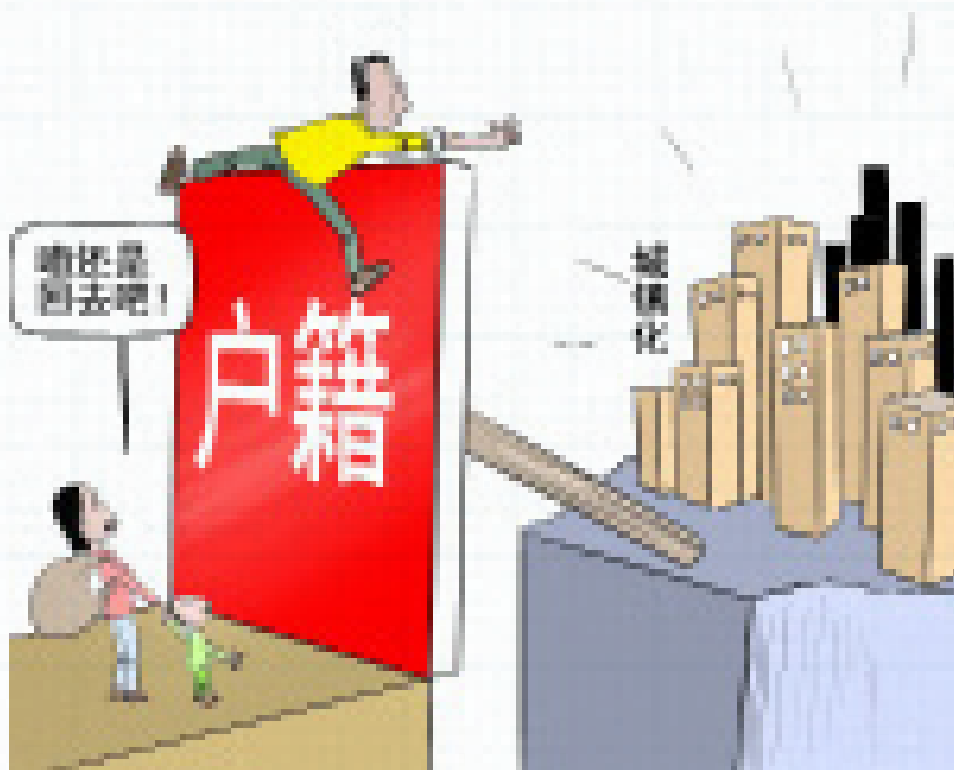
中国未来的城镇化进程正在面临着体制突围的现实挑战，如何让农民工真正融入城市已经成为下一步城镇化无法回避的问题

后工业化时代，人类已经掌握了控制大多数传染病的医学知识和技术，也完全掌握了空调技术，因此，现代社会的基本趋势是人口朝着亚热带甚至热带地区聚集。在这些地区，人均寿命也比较高。这是因为，寒冷的冬天对于人类情绪往往有负面影响，对高血压糖尿病等现代病的康复十分不利，从而