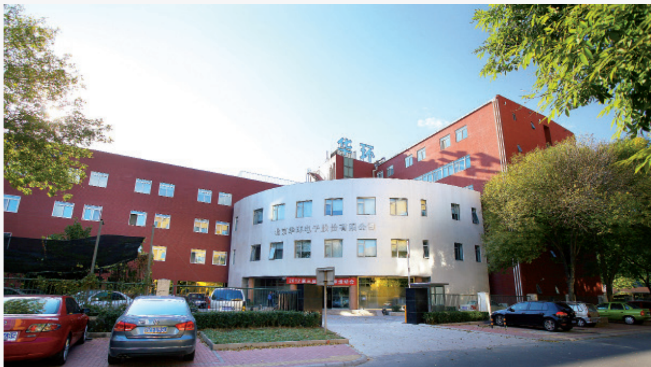
北京华环电子股份有限公司