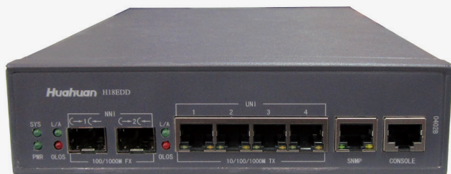
H18EDD-0402B 多业务分组接入终端