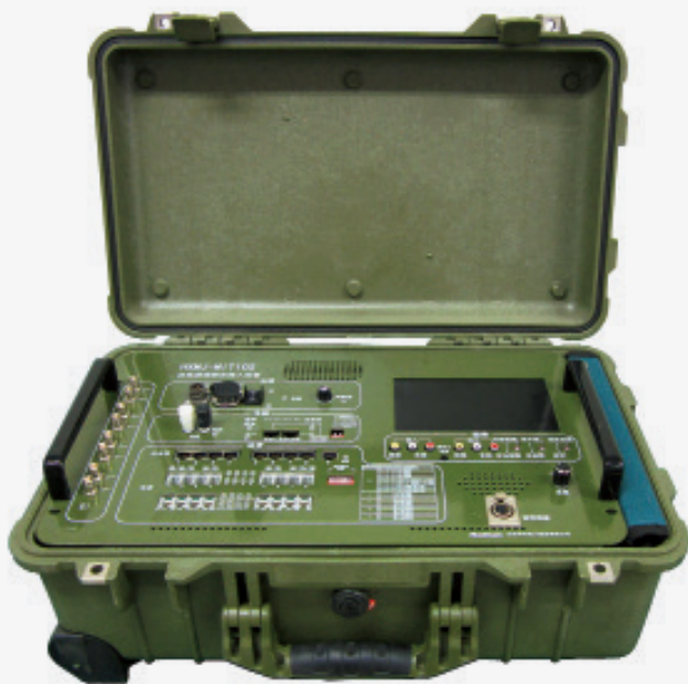
HXMJ-MIT102 应急通信综合接入设备