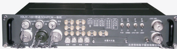
HXJY-1001 野战 SDH / PCM 一体机