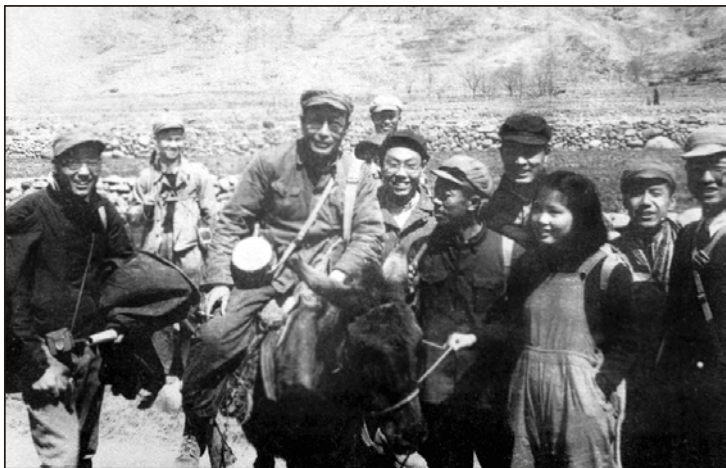
1950年清华地学系师生在河北平山