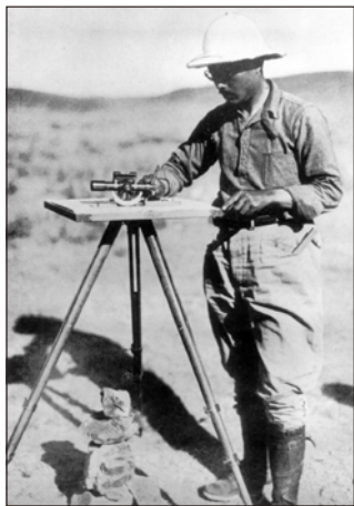
一九二七年袁复礼在哈那郭罗

从包头出发，徒步西行沿途考察，途经民勤、额济纳南、哈密，于1928年3月8日抵乌鲁木齐。随之在天山南北连续考察达3年零7个月，之后沿天山北麓向东，过奇台、额济纳北，于1932年5月抵呼和浩特结束野外工作。先生不畏艰辛，连续5年在野外勤奋考察研究，取得了丰硕成果，为中国人争了气。若干重大发现（其中，如所采集的72具爬行动物化石）震动世界学术界，1934年瑞典皇家科学院为此授予“北极星”奖章。所采集的大宗标本提供各方面专家研究，为推动我国古脊椎动物学等发展做出了特殊贡献。一些地质成果在西北具有奠基性；更有趣的是据新疆地质工作者称，因先生为百姓找水、改进冶铁技术，某些地方曾建有“复礼庙”予以纪念。