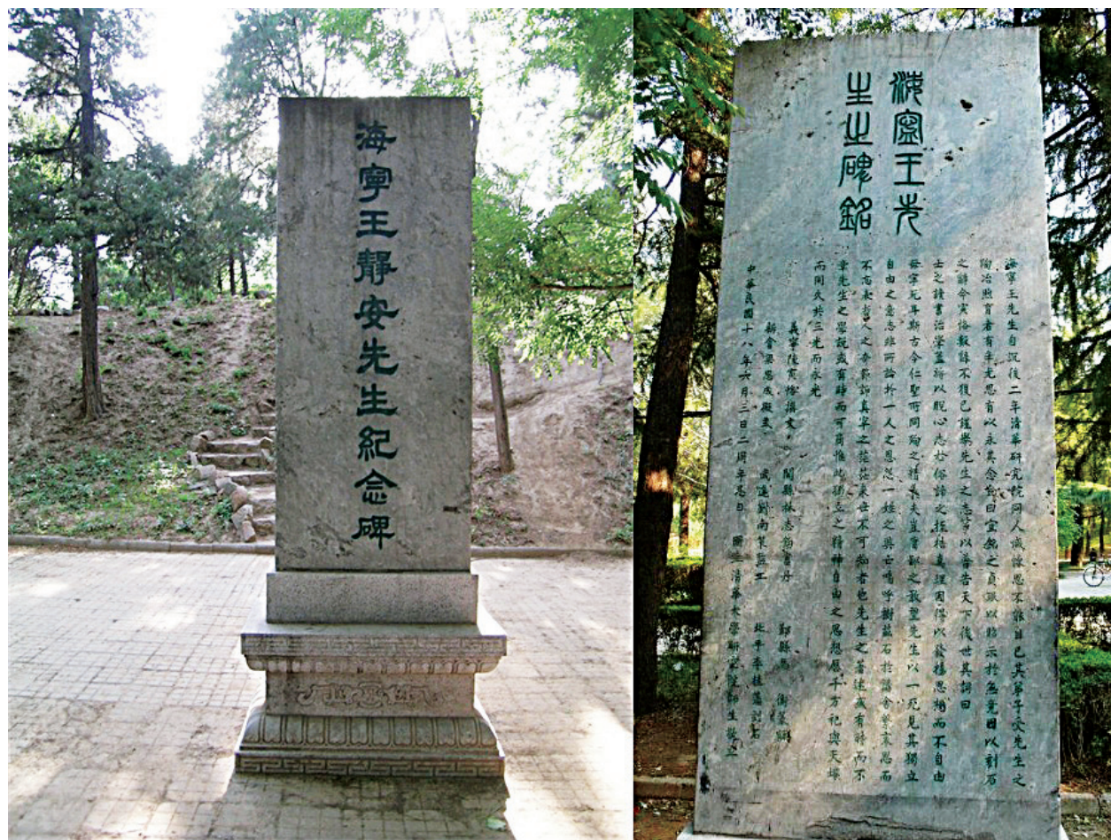
清华园内的海宁王静安先生纪念碑

西北地理和元史研究曾被称为：“绝域与绝学”，据郭丽萍新著《绝域与绝学》的研究，清代中叶，徐松、龚自珍等人都是这一个领域的开拓和推动者，到了20世纪初，这一研究领域又成为近代学术中的一门显学。王国维进入清华后，在短时间内能在这一领域脱颖而出，说明必有其